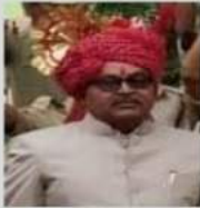
Patron Dr. Satish Kaushik