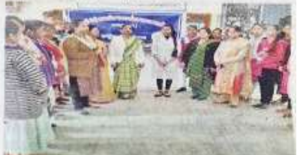
भरतपुर। आरबी गर्म महाविद्यालय के कार्यक्रम में मौजूद छात्राएं।