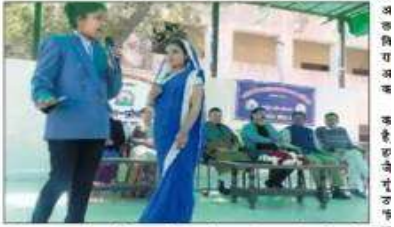
सांस्कृतिक कार्यक्रम के अंतर्गत नाटकों का मंचन व देशभक्ति गीत प्रस्तुत किये गये।