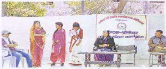
भारतपुर। आरटी देवी कन्या महाविद्यालय में नाटक का मंचन करते हुए छात्ररस।