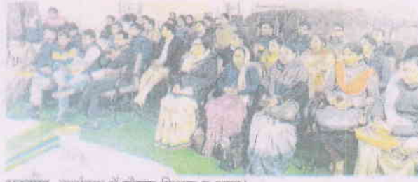
भरतपुर, कार्यक्रम में मौजूद शिक्षक व अन्य।