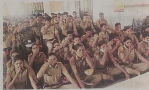
किशनगढ़ के आरके पाटनी राजकीय स्नातकोत्तर महाविद्यालय में सेमिनार में योग करती एनसीसी कैडेट्स।