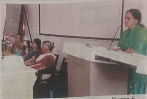
किशनगढ़ के आरके पाटनी राजकीय स्नातकोत्तर महाविद्यालय में सेमिनार को सम्बोधित करती वक्ता। पत्रिका

वर्षों से कॉलेज दिवस की परेड रही हैं। प्राचार्य भी सभी सदस्यों कार्य करते हुए की तरफ बढ़ने किया। प्रभारी के एनएसएस के एस. पी. संपर्क अधिकारी समन्वयक मौजूद रहे।