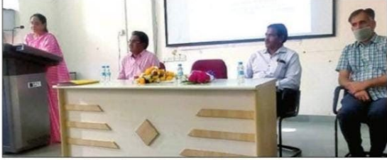
किशनगढ़। रकंपा में फैकल्टी डेवलपमेंट प्रोग्राम को संबोधित करते वक्ता।