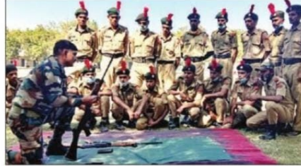
देवली। राजकीय महाविद्यालय में शस्त्र प्रशिक्षण लेते एनसीसी कैडेट्स।