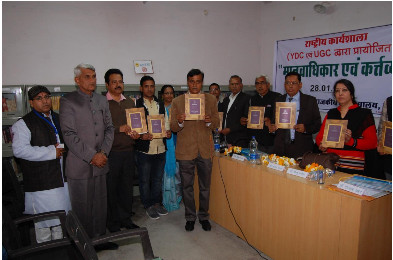
Figure 1 DIGNATORIES AT CONFERENCE