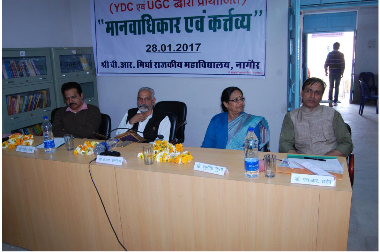
Figure 3 - CHIEF GUESTS AT CONFERENCE