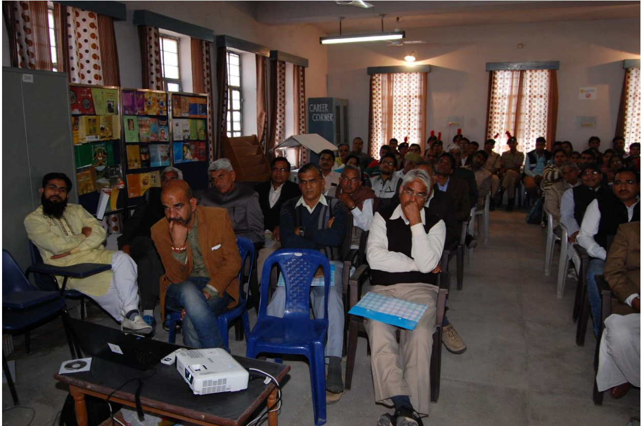
Figure 2 AUDIENCE HALL