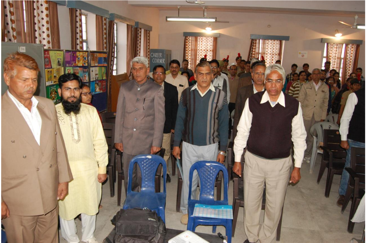
Figure 6 - GUESTS AT THE AUDIENCE HALL