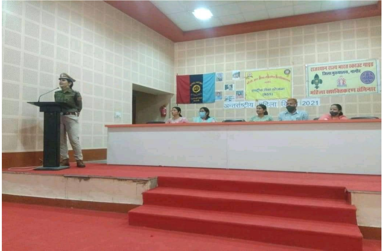
Women's Day celebration