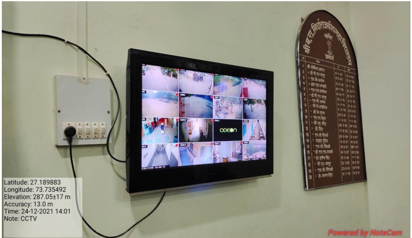
CCTV cameras for girl's safety