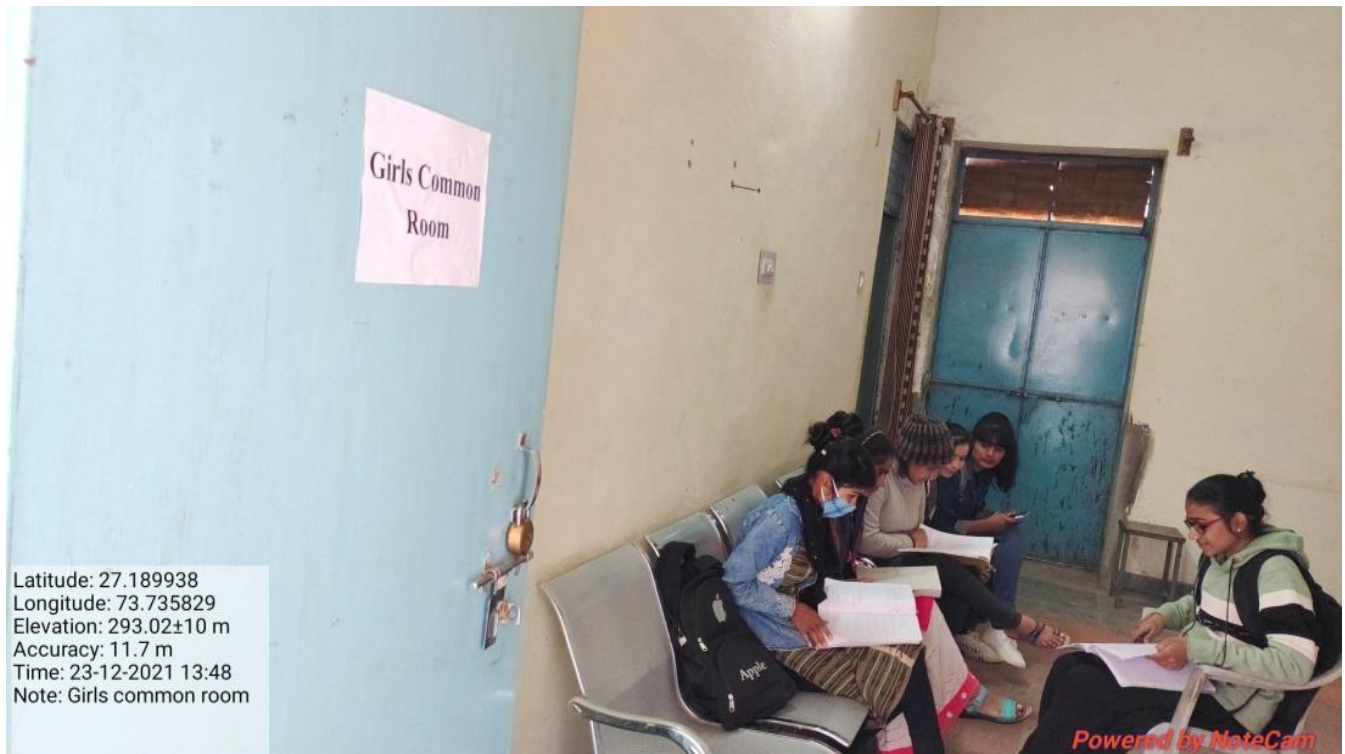
Girls Common room