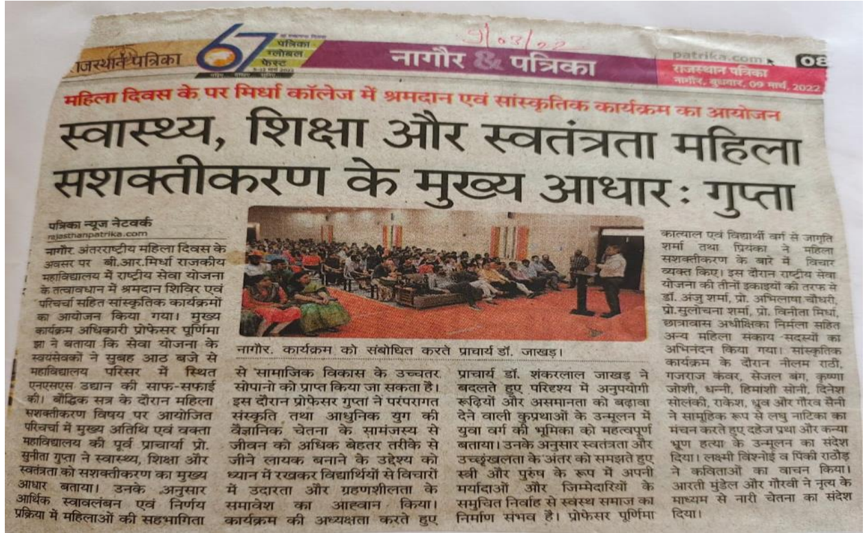
Lecture delivered on Legal rights for women