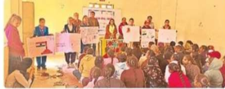
नागौर. मतदाता दिवस को लेकर बनाए गए पोस्टर दिखाती छात्राएं।