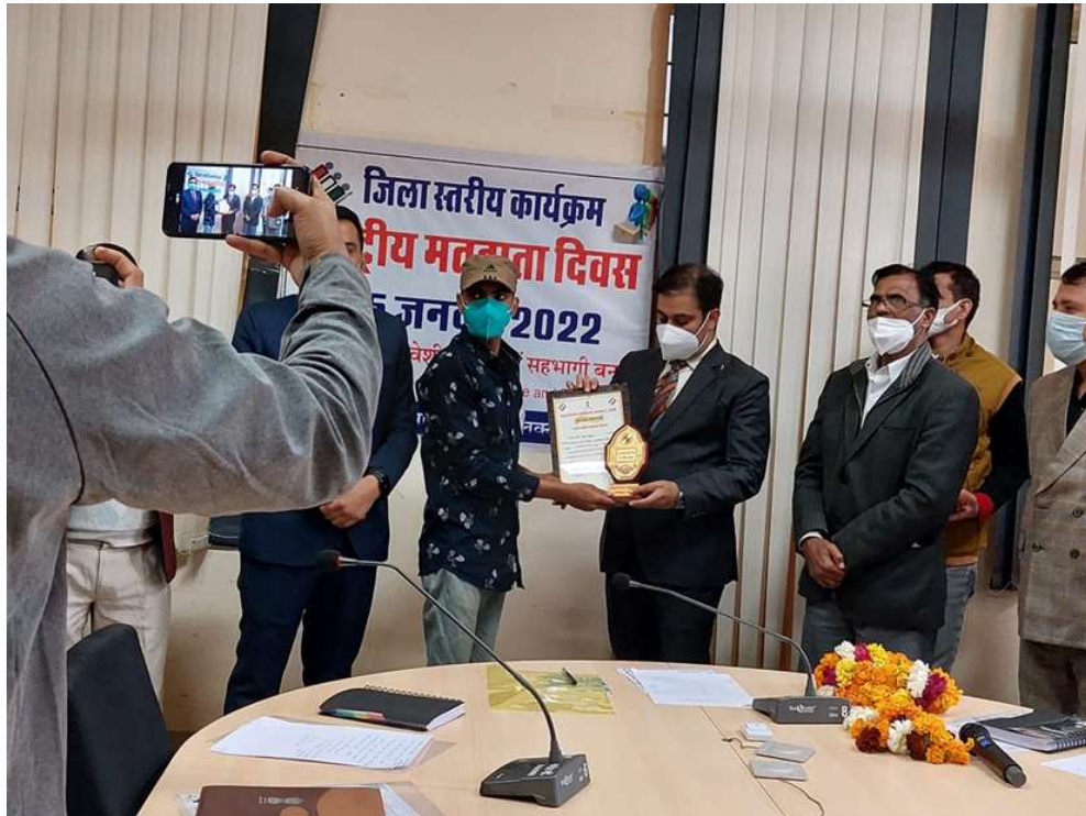
Event – Students were awarded by District Collector, Nagaur on National Voters Day (2022)