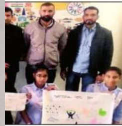
विजेता प्रतिभागी। -हेक्टरज चट्टीक