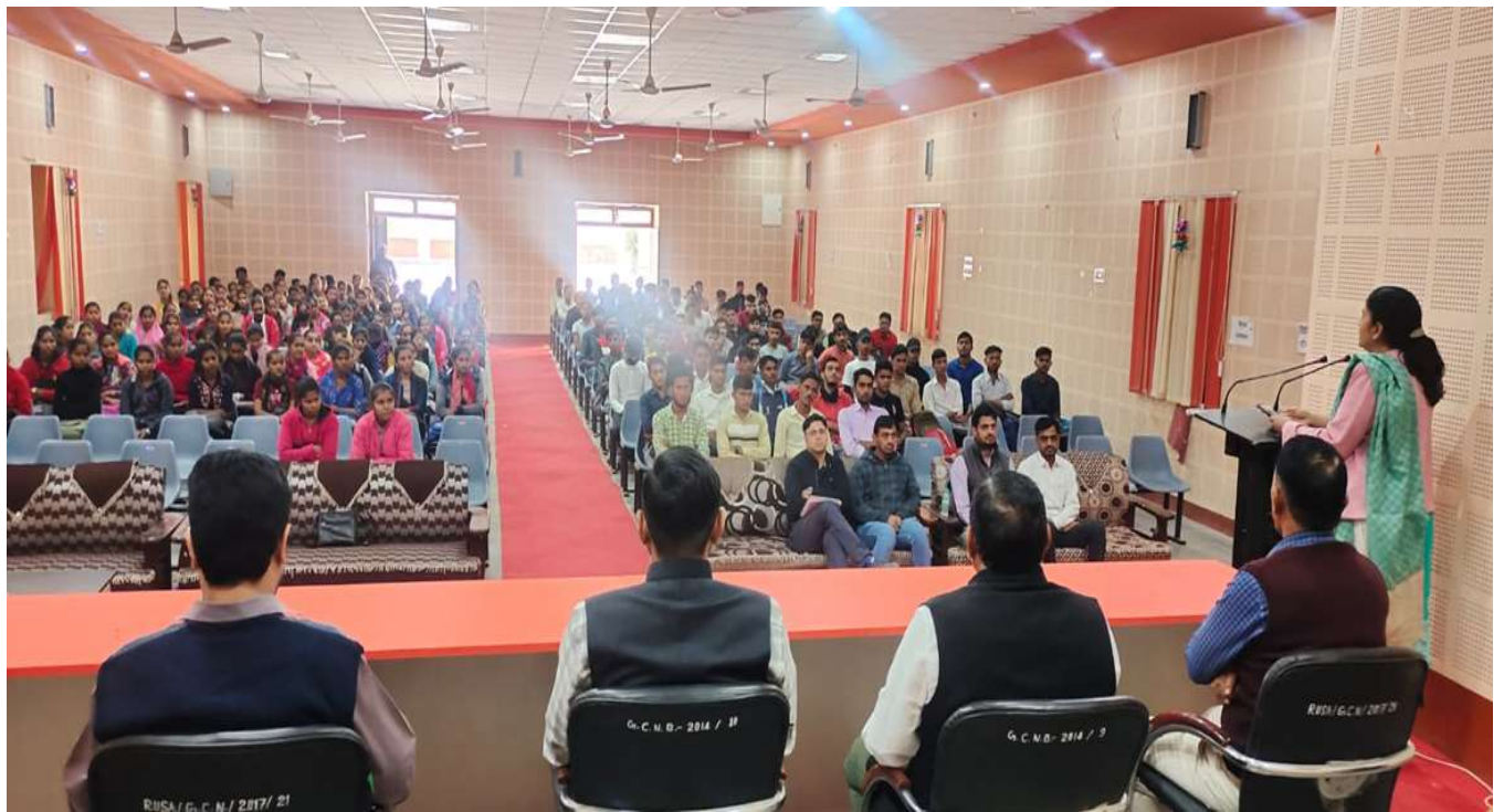
(Voter Awareness Seminar at College- 02.12.2022)