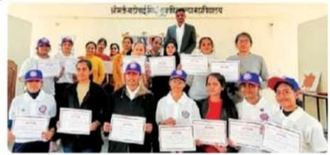
नागौर. महिला कॉलेज में प्रमाण पत्र के साथ छात्राएं।