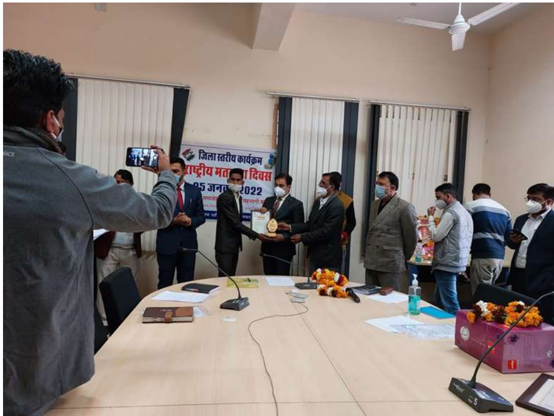
(Date- 25.01.2022- National Voters Day).