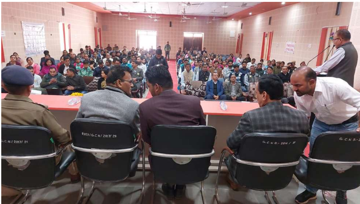
Event – District Level 13 th National Voters Day Programme at College (25 th January, 2023)