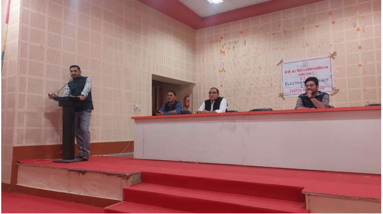
Event – SDM, Nagaur as chief speaker in voter awareness seminar at College(02.12.2022).