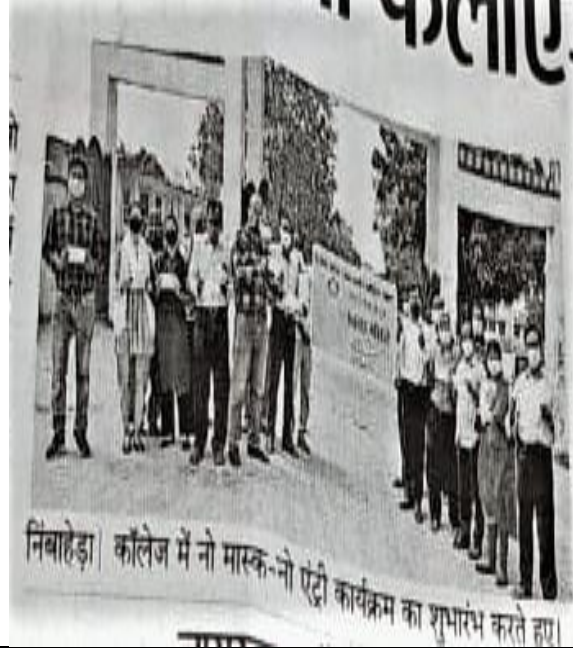
निम्बाहेड़ा. कॉलेज में नो मास्क-नो एंट्री कार्यक्रम का शुभारंभ करते हुए।