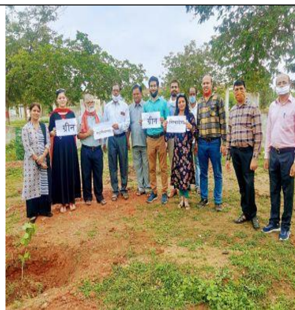
ग्रीन निम्बाहेड़ा कैम्पेन