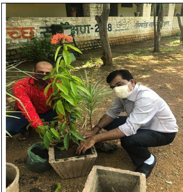
महाविद्यालय में वृक्षारोपण कार्यक्रम

सारांशतः कोरोना जैसे विकट काल में भी ऑनलाइन मोड पर राष्ट्रीय सेवा योजना की गतिविधियों का संचालन होता रहा और एनएसएस अपने वांछित लक्ष्यों को प्राप्त करने में सफल रहा।