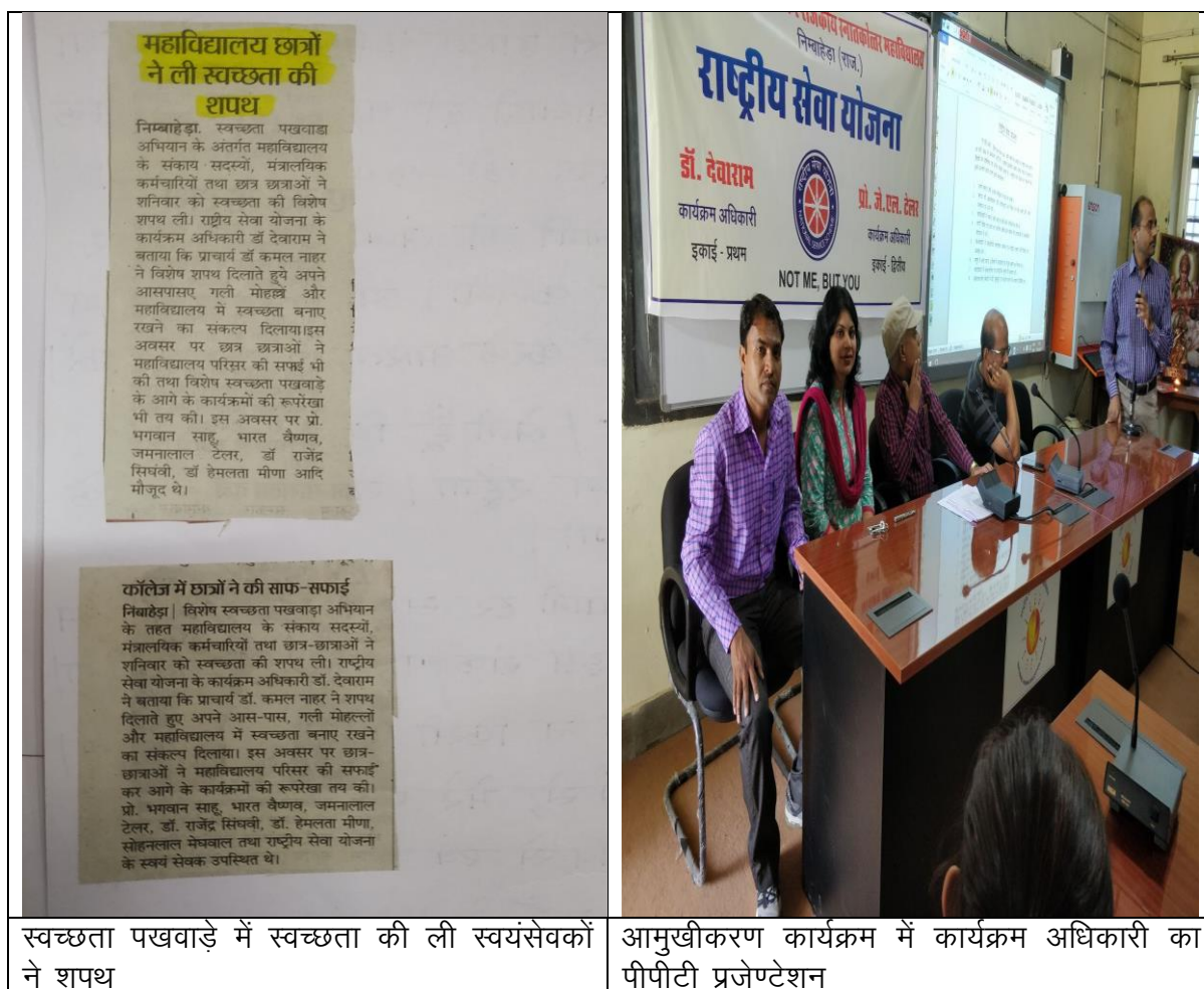
स्वच्छता पखवाड़े में स्वच्छता की ली स्वयंसेवकों ने शपथ

इसप्रकार सत्रपर्यंत राष्ट्रीय सेवा योजना के स्वयंसेवकों ने मानव सेवा एवं मानवीय उद्धार के संबंध में अनेक कार्य किए, जो प्रशंसनीय हैं।