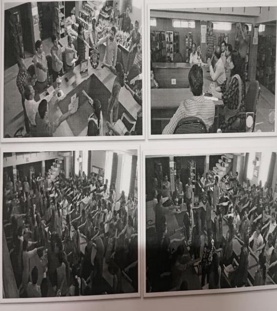
राष्ट्रीय एकता की शपथ लेते स्वयंसेवक