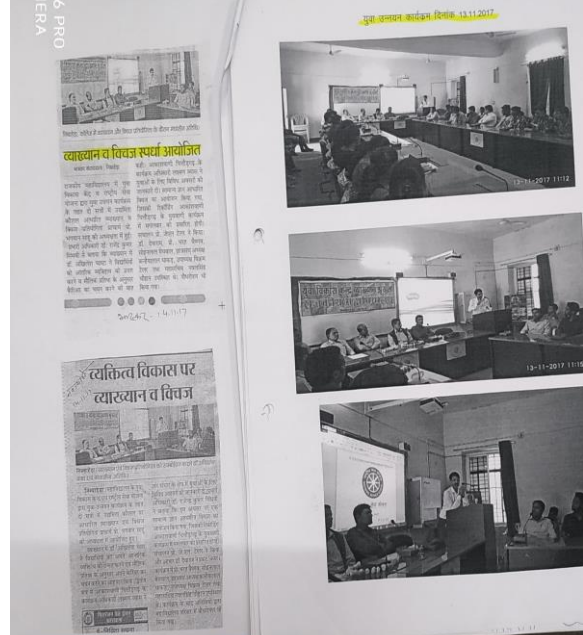
युवा उन्नयन कार्यक्रम में स्वयंसेवकों की भागीदारी