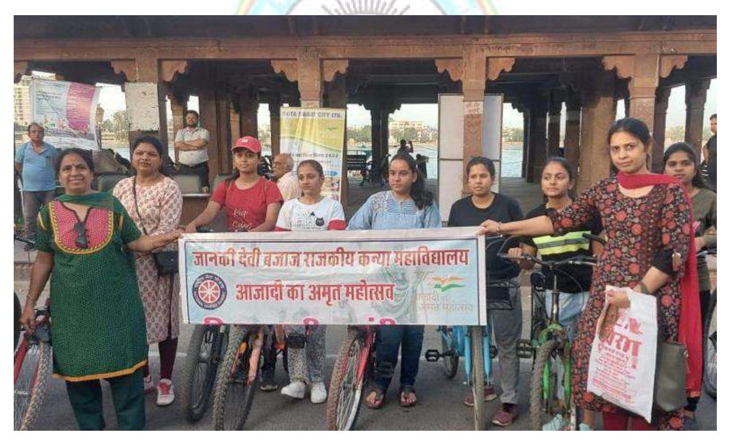
During Azadi Ka Amrit mahaotsav programme