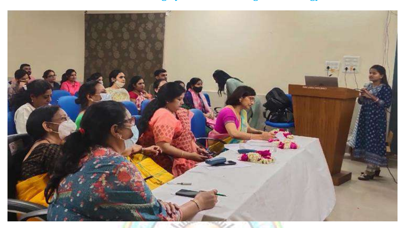
Student during an Annual Research Seminar