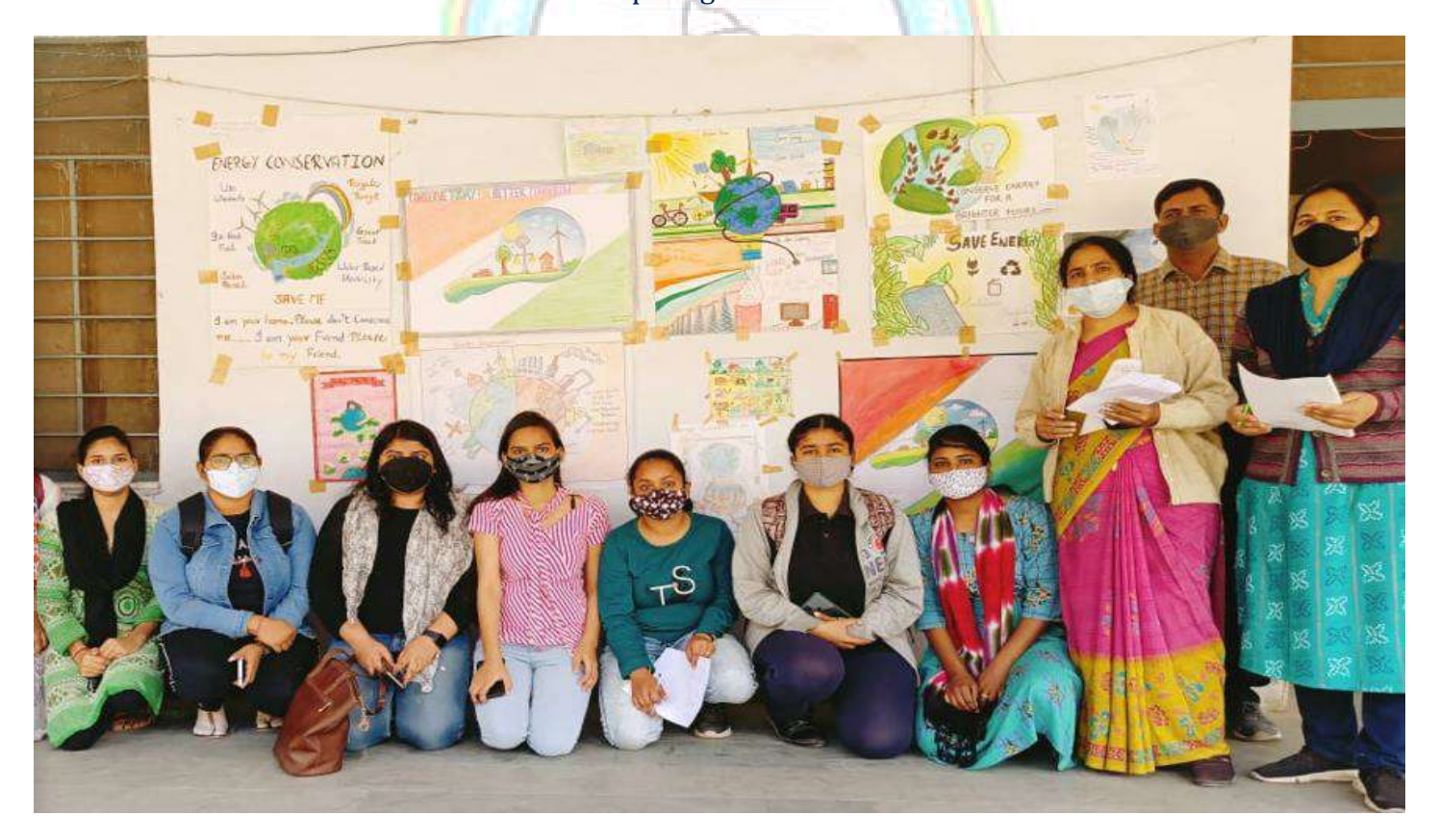
Students participating in poster competition