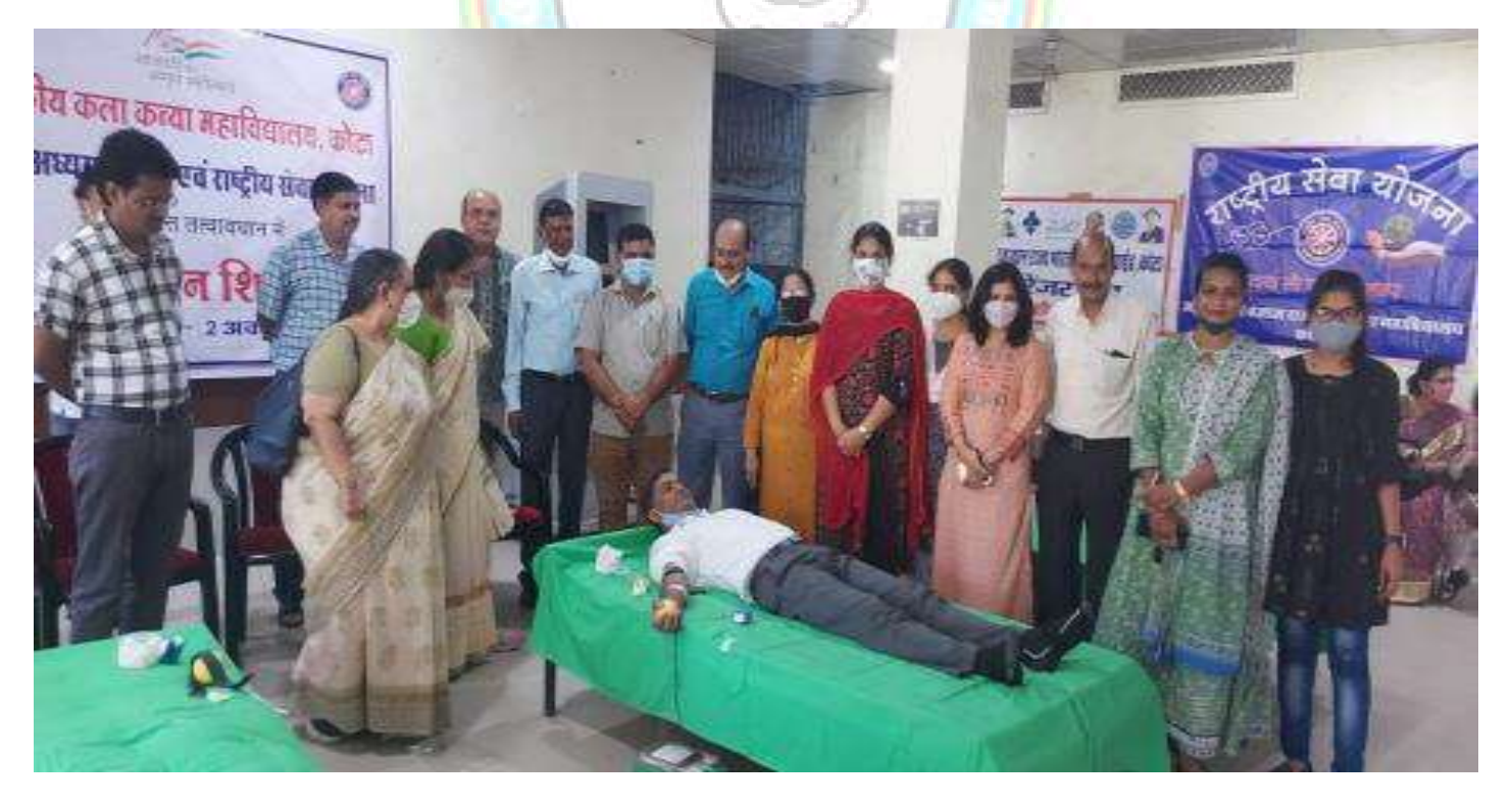
Blood donation camp