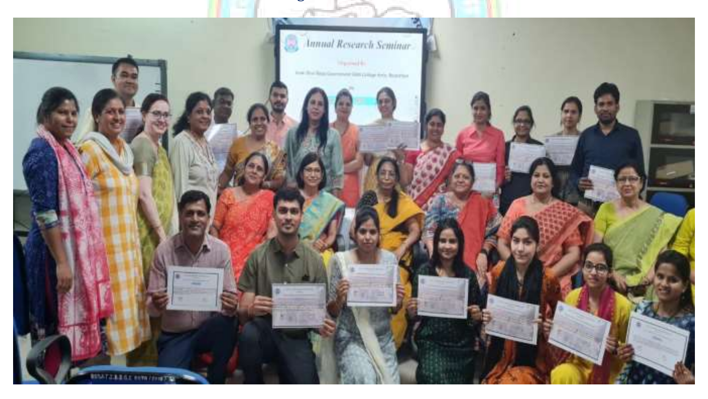
Research scholars and faculty during ARS