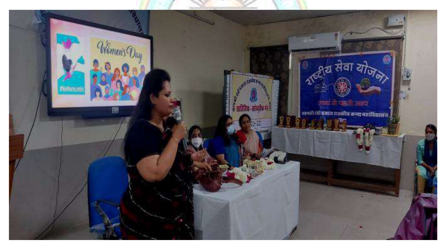
Programme on health and hygiene by NSS and Women's cell