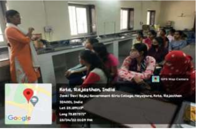
B. Sc. Physics students during a practical session