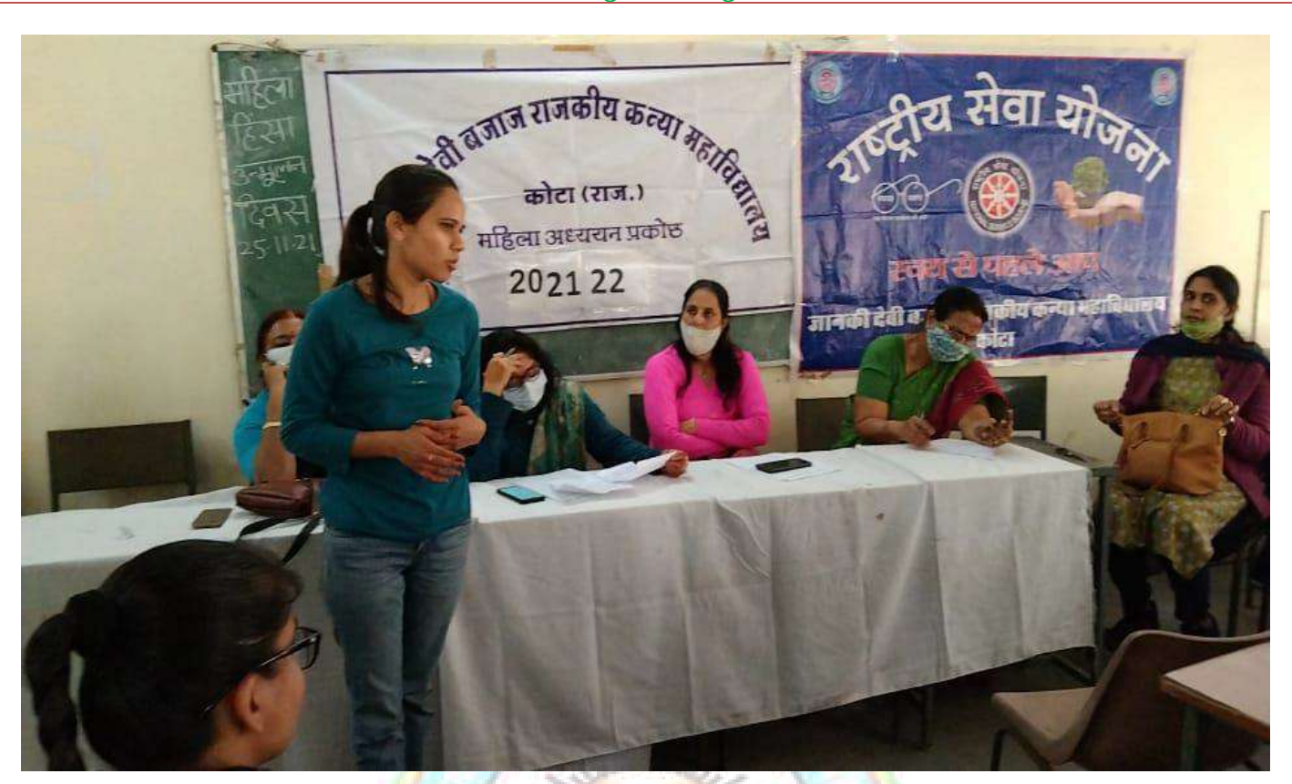
Student participating in a programme organized by Women's cell & NSS