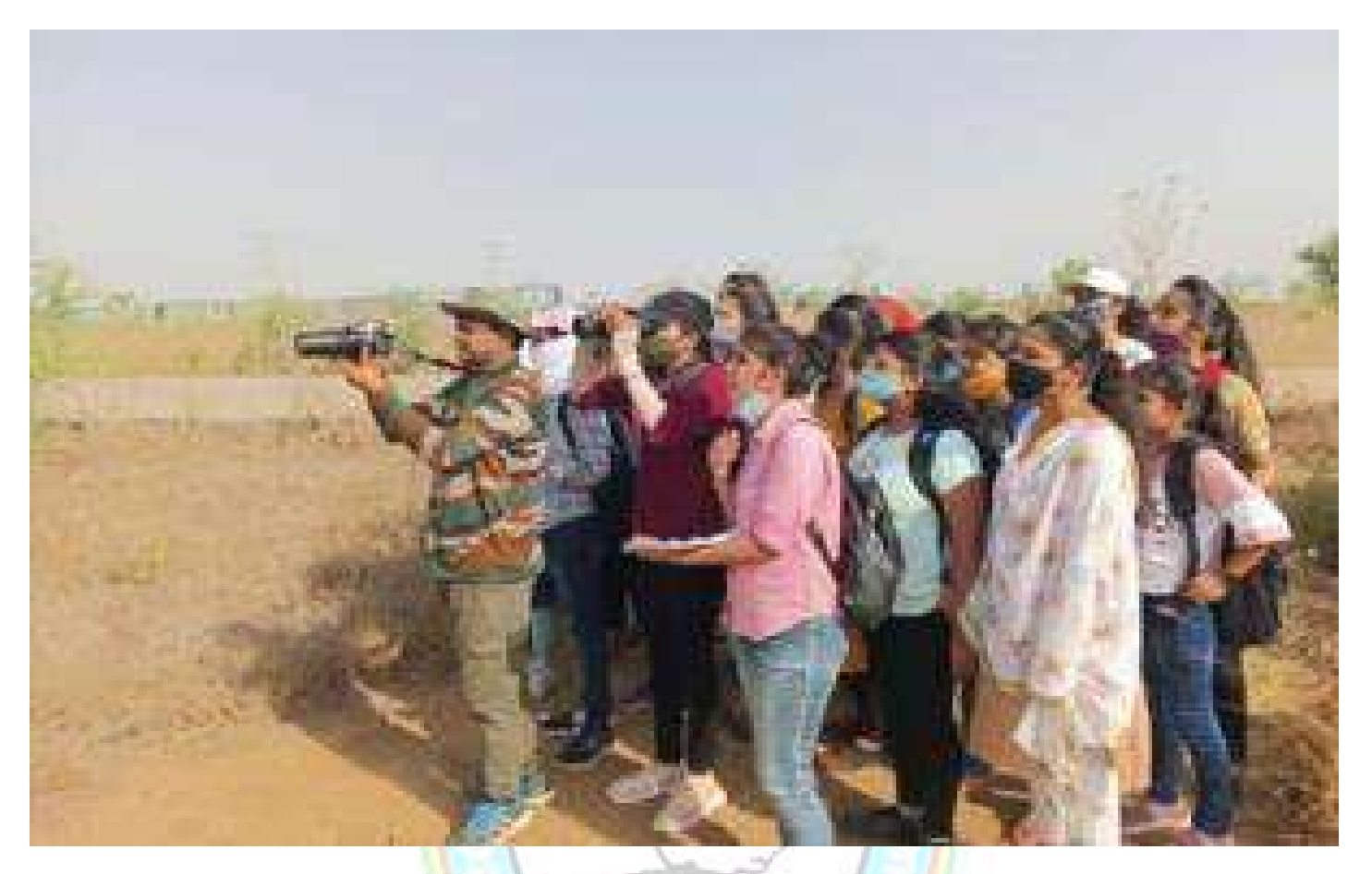
M. Sc. Zoology students during a wildlife excursion at Abheda Biological Park, Kota