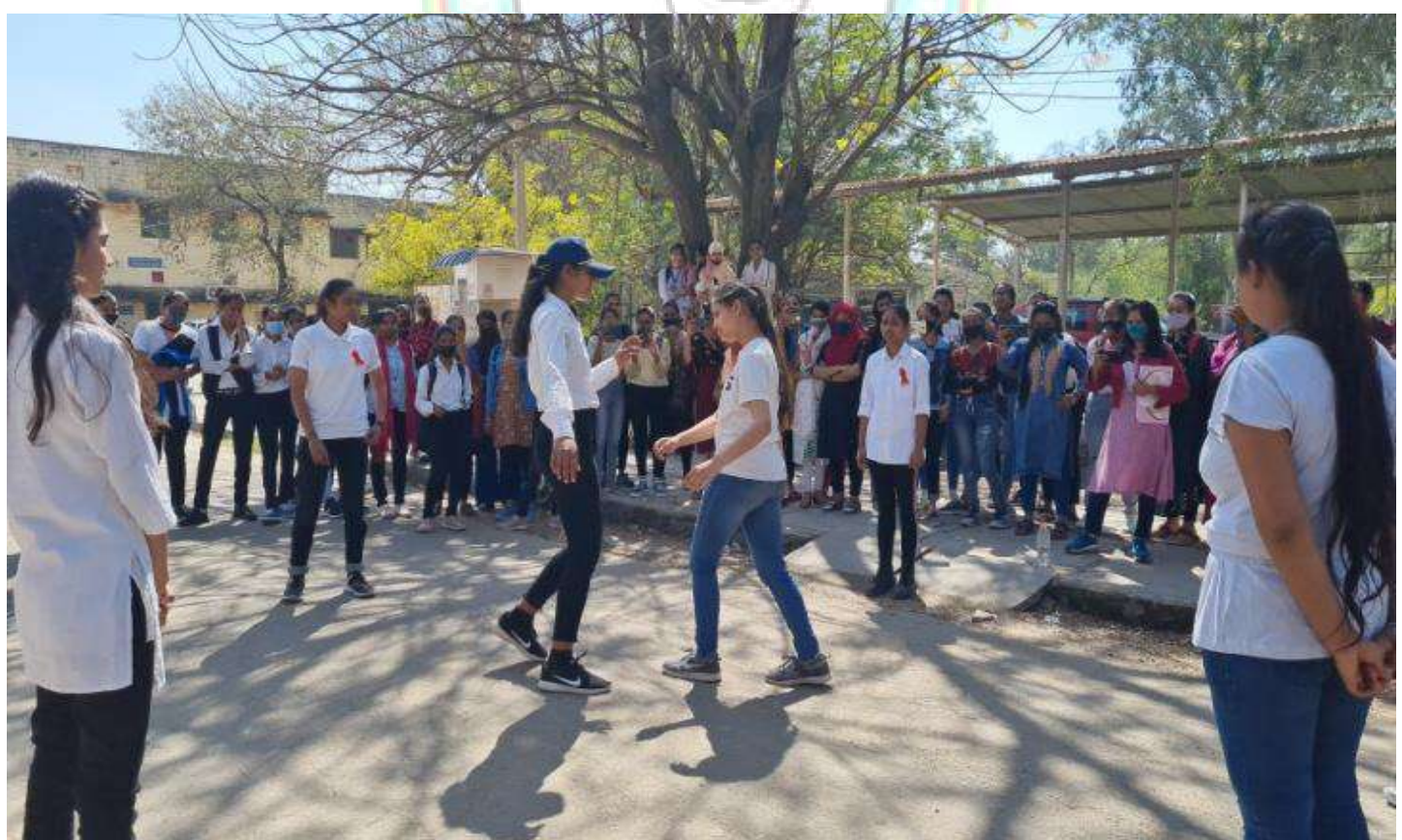
Participating in Nukad Natak