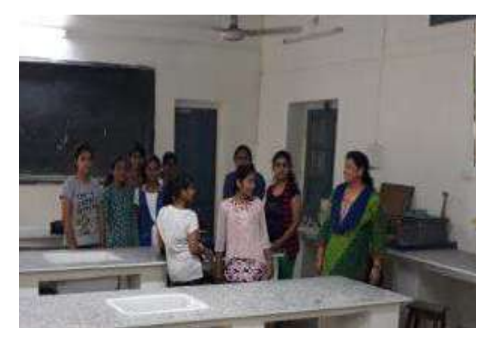
B. Sc. students in Botany lab during practical.