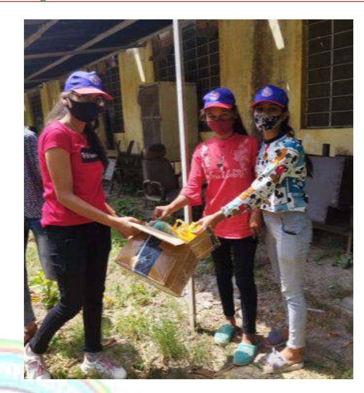
During cleanliness programme