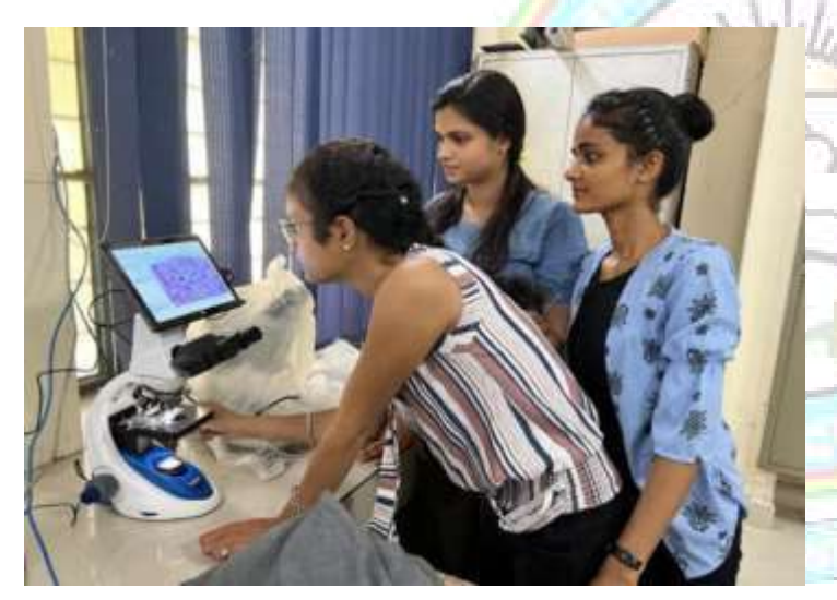
Students of M. Sc. Zoology using digital microscope