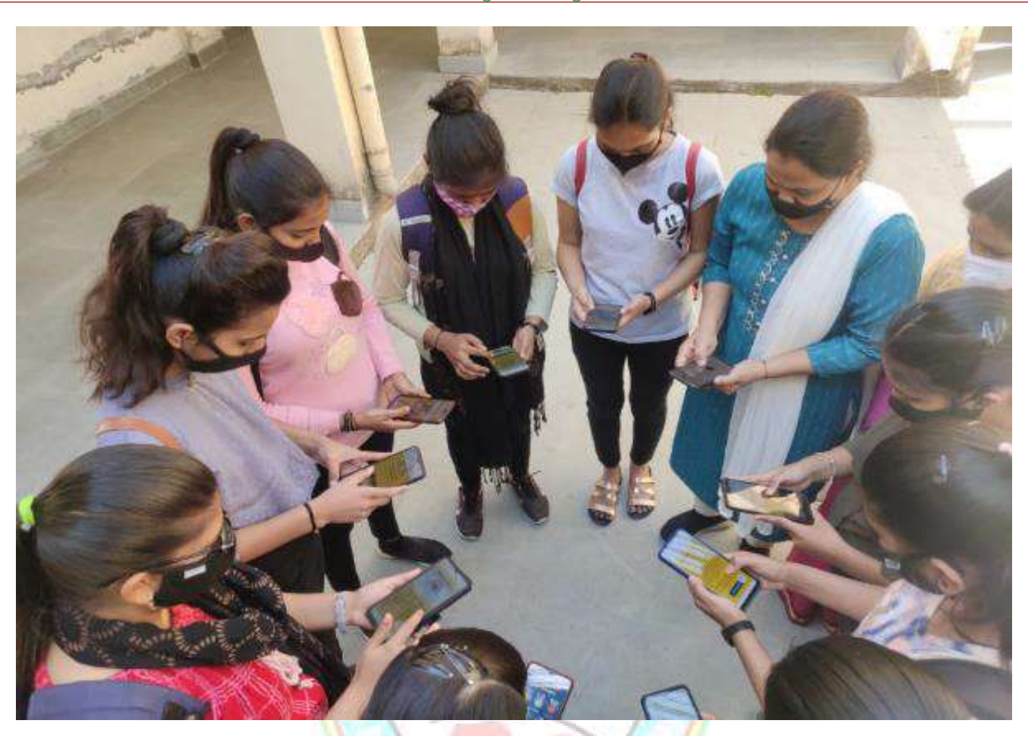
During SWEEP programme by ELC