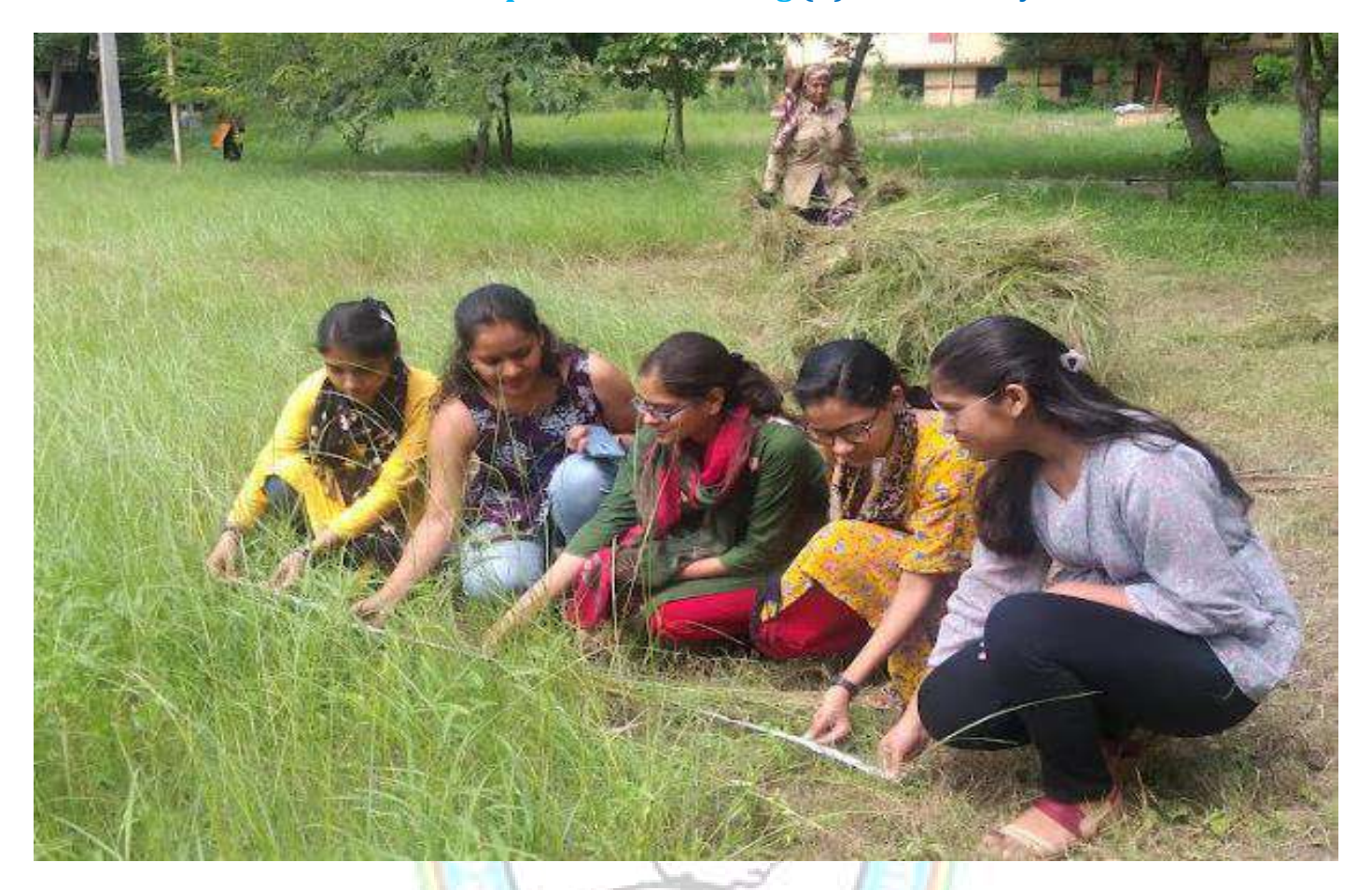
Grassland survey by M. Sc. Botany students