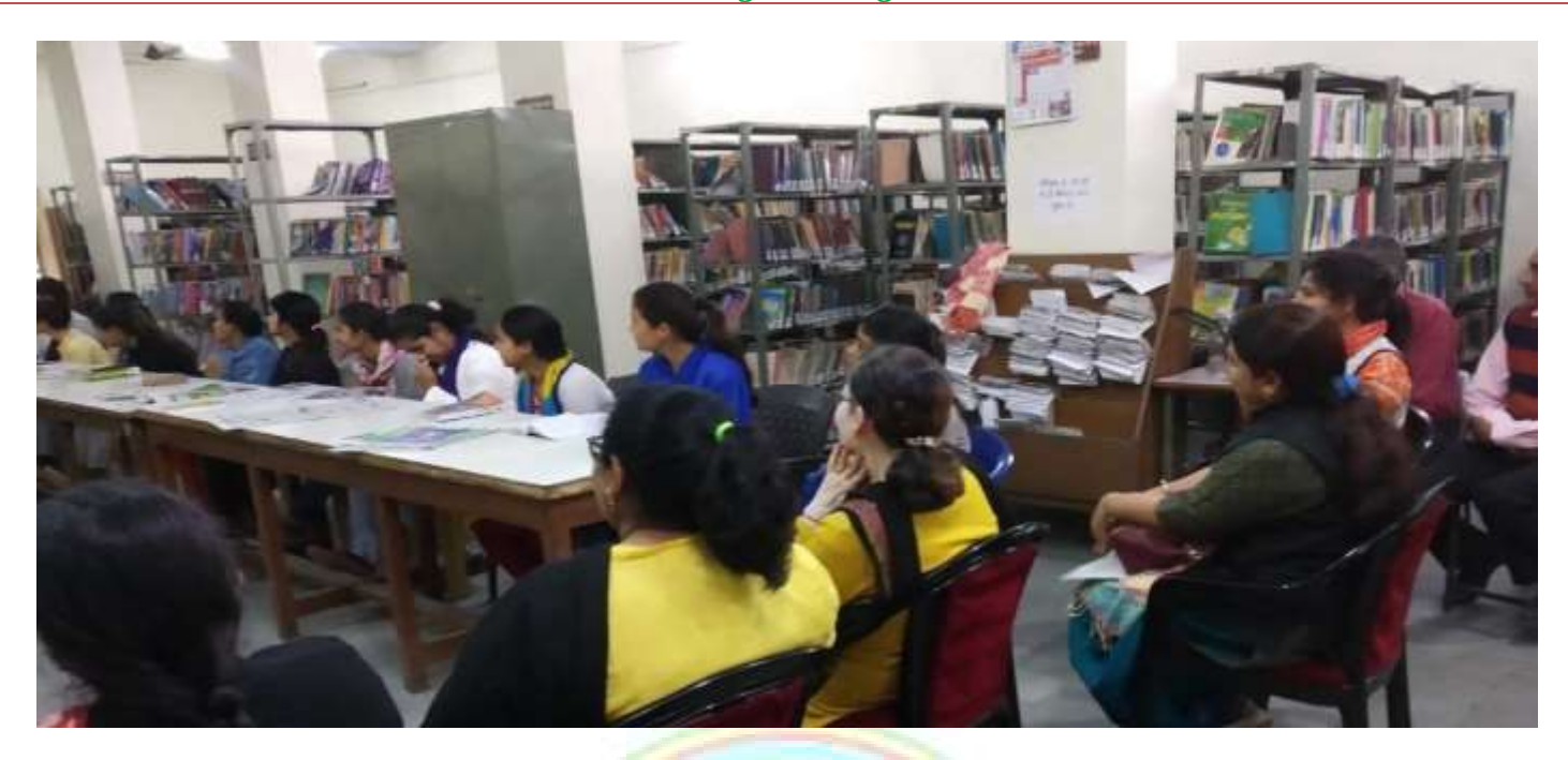
Participating in accessing of internet use for library automation software