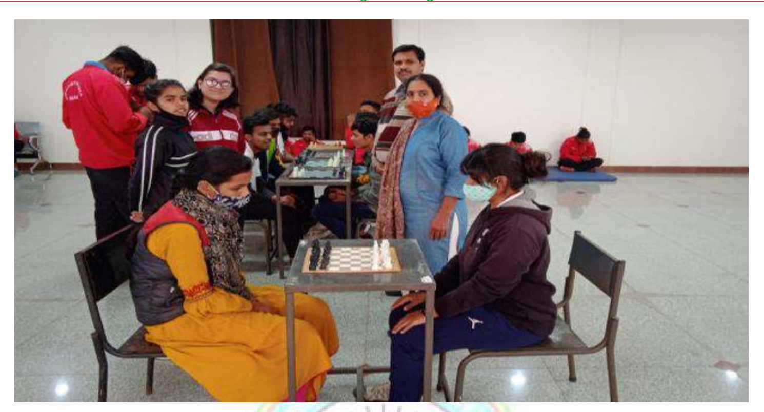
Students participating in Chess competition