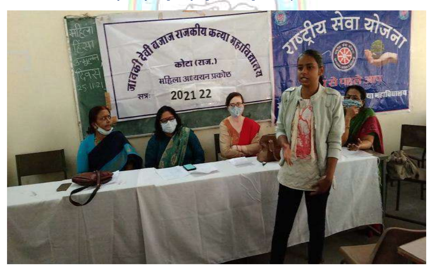
Student participating in a programme organized by Women's cell & NSS