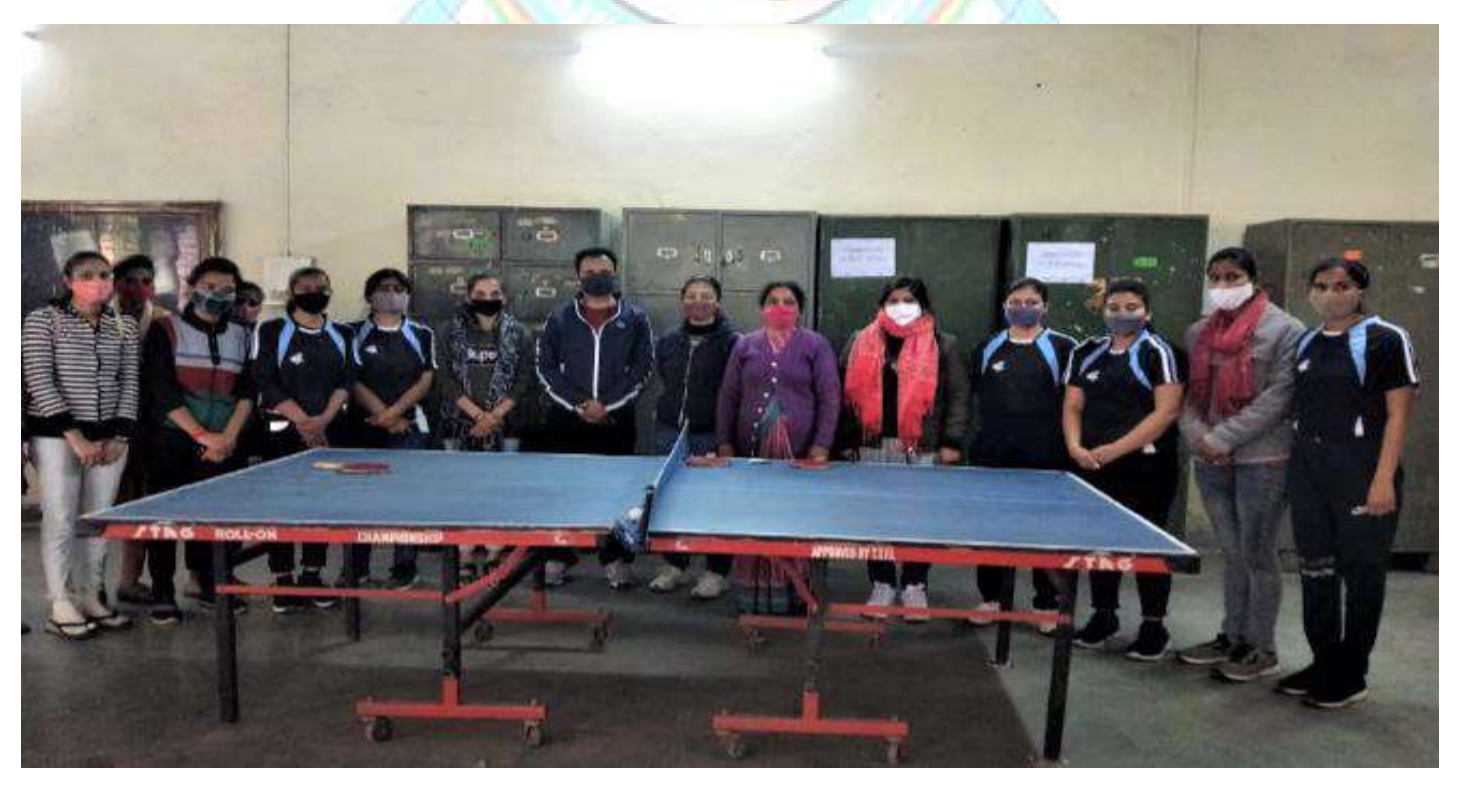
Students during practicing of TT match