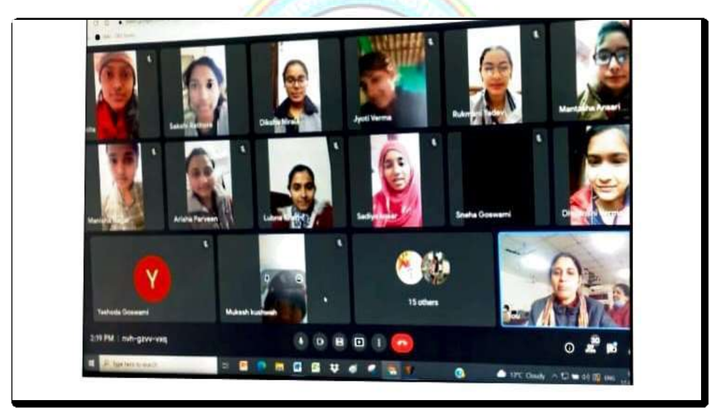
Students participating in an online quiz