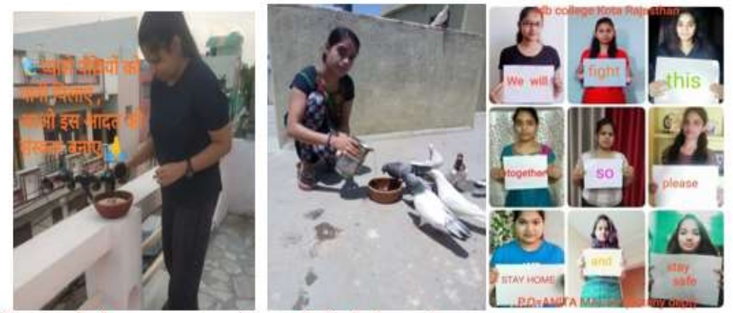
लॉकडाउन के दौरान घर पर छात्राओं द्वारा पक्षियों की सेवा करते हुए