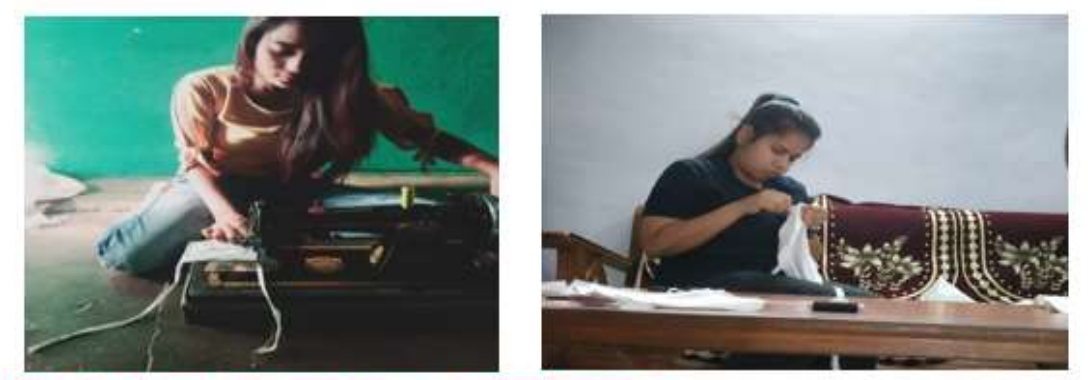
अप्रैल माह में लॉकडाउन के दौरान घर पर मास्क तैयार करती स्वयंसेविका

अप्रैल माह में छात्राओं द्वारा लॉकडाउन के दौरान घर पर ही मास्क बनाए गए, पोस्टर के माध्यम से कोरोना जागरूकता का संदेश दिया गया,छात्राओं द्वारा पक्षियों के लिए परिंडे बांधे गये। मई माह में छात्राओं द्वारा विभिन्न वीडियो बनाकर कोरोना जागरूकता का संदेश विभिन्न ग्रुप में भेजा गया। जून माह में 5 जून को पर्यावरण दिवस पर पोस्टर प्रतियोगिता का आयोजन किया गया। 21 जून को छात्राओं द्वारा "योग एट होम योग विंद फैमिली" थीम पर राष्ट्रीय सेवा योजना की ओर से सभी कार्यक्रम अधिकारी तथा स्वयंसेवकों द्वारा अपने घर में ही योग व प्राणायाम किया गया।