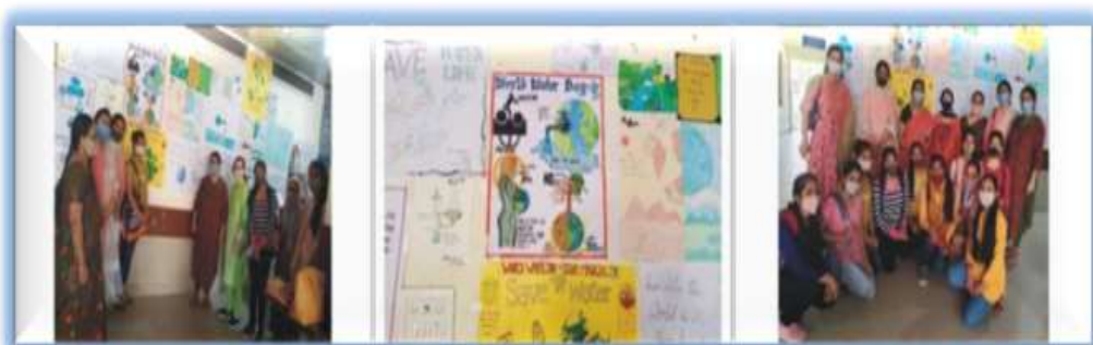
दिनांक 22 मार्च 2021 वनस्पति शास्त्र विभाग द्वारा "वर्ल्ड वाटर डे" पर पोस्टर एवं प्रश्नोत्तरी प्रतियोगिता