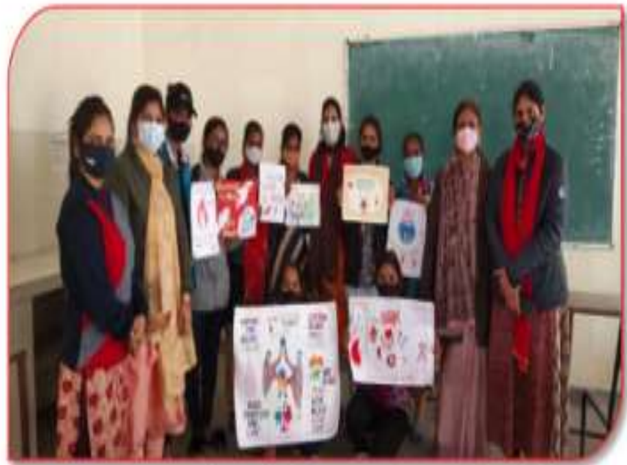
11 फरवरी 2021 एचआईवी एड्स के प्रति जागरूकता विषय पर स्लोगन प्रतियोगिता