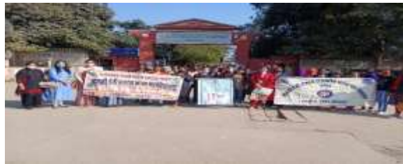
6 फरवरी 2021 सड़क सुरक्षा कार्यक्रम