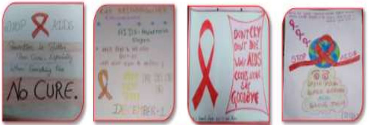
8 फरवरी 2021 रक्तदान महादान विषय पर पोस्टर प्रतियोगिता