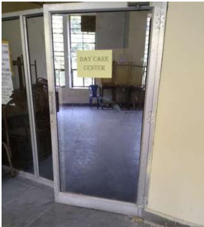
Day care unit

Measures initiated by the Institution for the promotion of gender equity