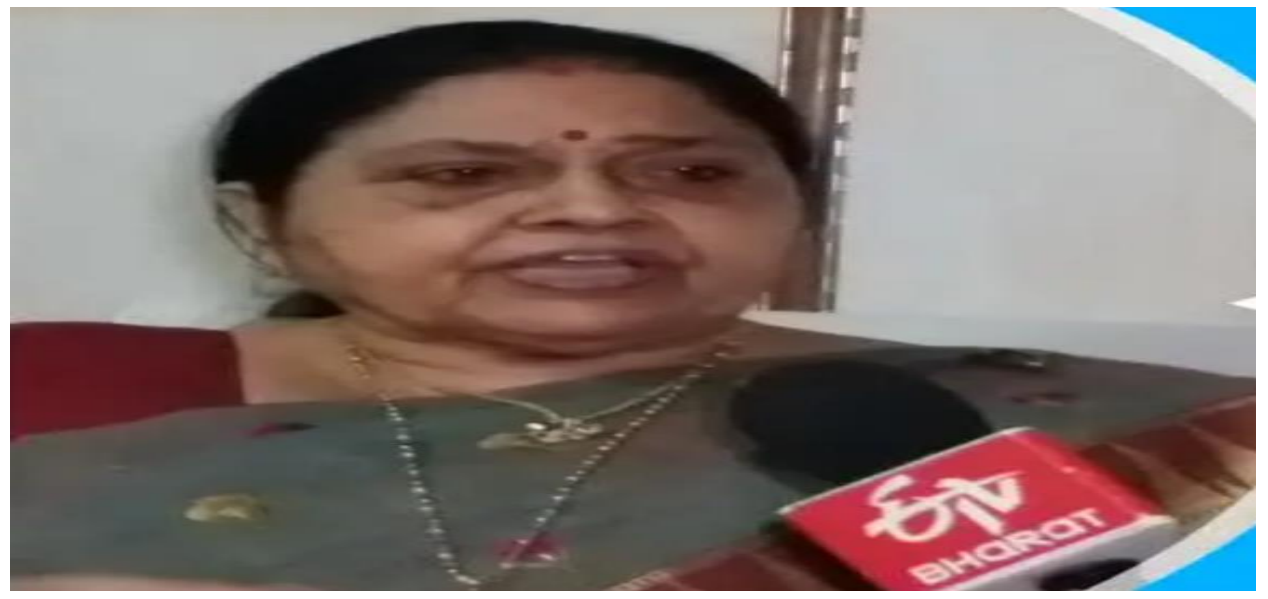
Smt. Suman Shringi First Mayor, Nagar Nigam Kota