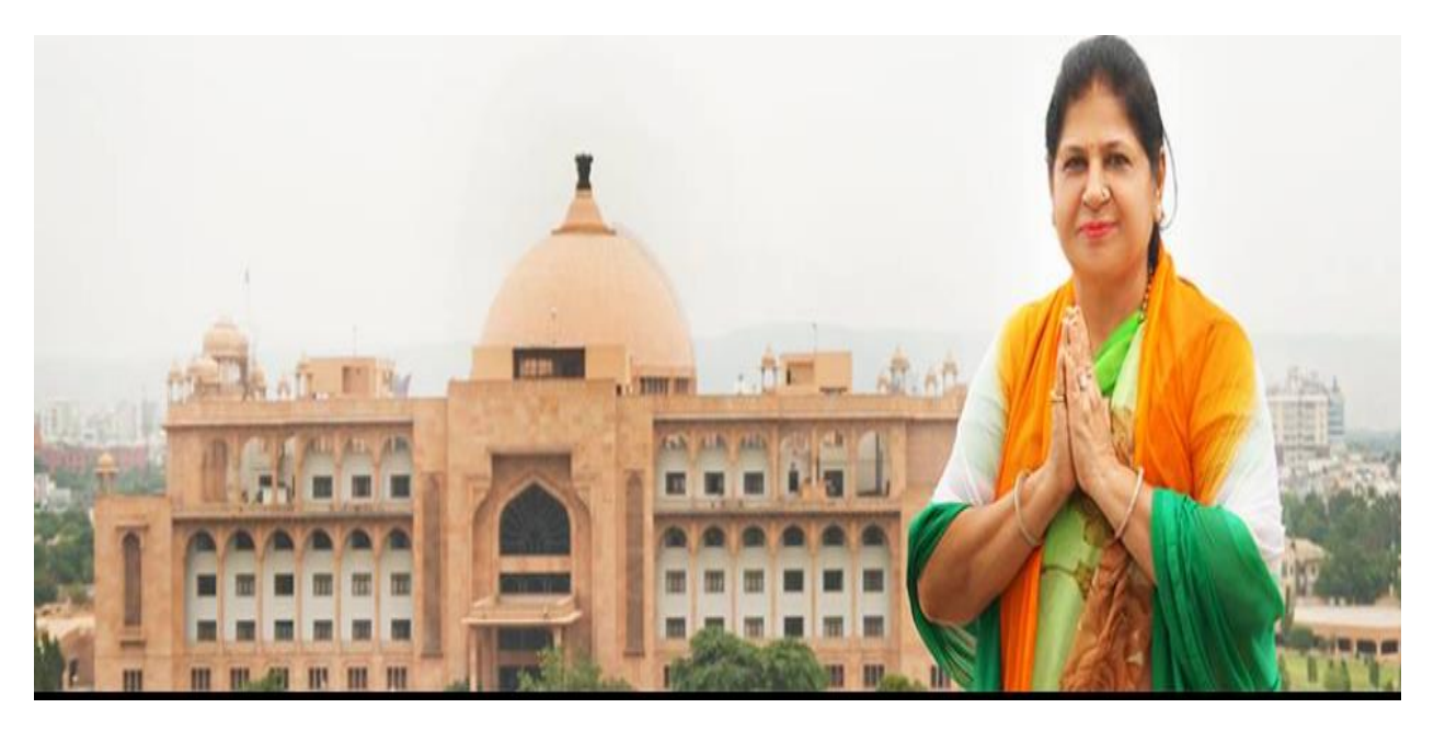
Smt. Poonam Goyal Ex MLA