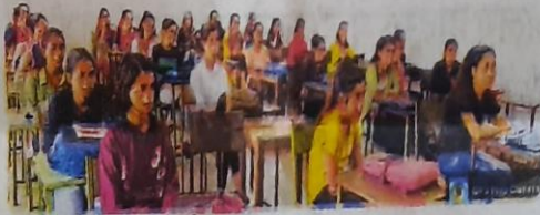
चौमूँ, विचार गोष्ठी में उपस्थित छात्राएं।

उन्होंने शारीरिक एवं मानसिक स्वास्थ्य की परस्पर निर्भरता पर प्रकाश डाला और महाविद्यालय में मानसिक स्वास्थ्य परामर्श केन्द्र के बारे में जानकारी दी। इस मौके पर