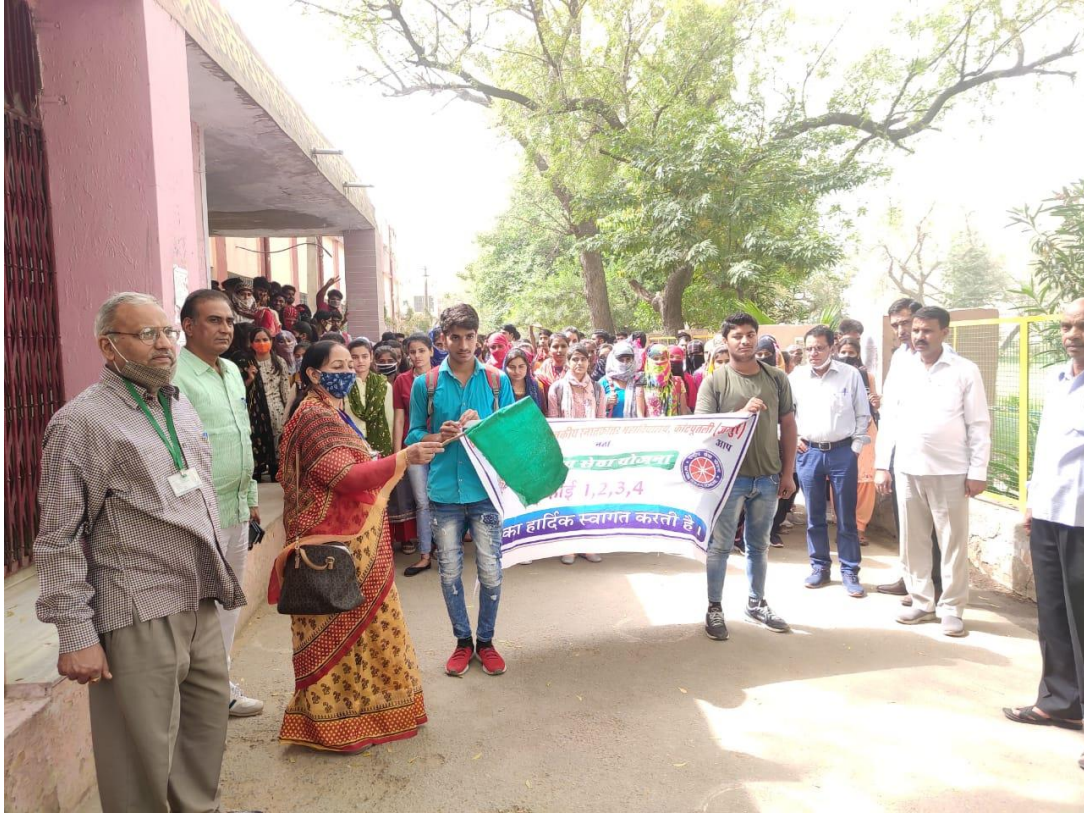
शहीद दिवस रैली