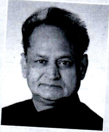
अशोक गहलोत माननीय मुख्यमंत्री, राजस्थान