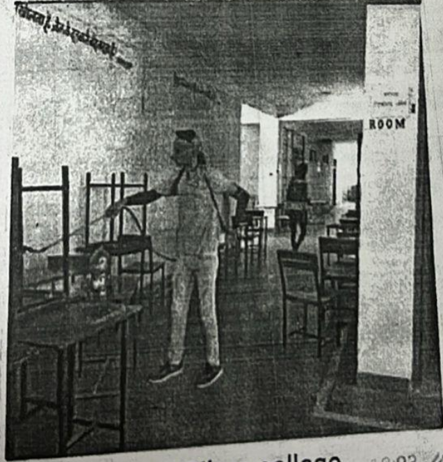
Sentization in Bilara college - 18:03 ✓