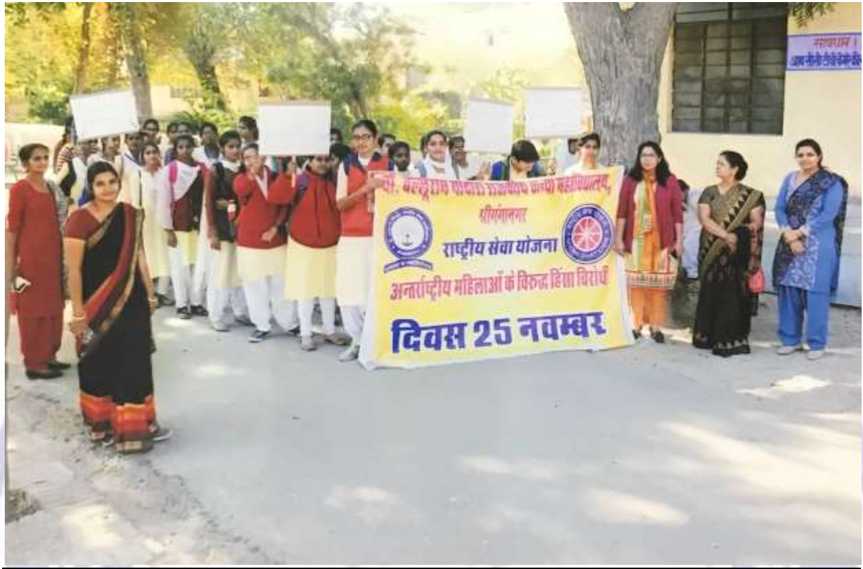
Rally on Prevention of Violence against Women(2019-2020):-