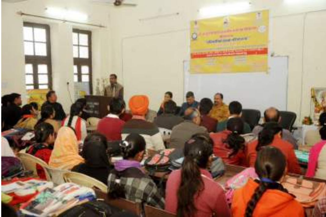
(Inaugural Session : Feb.2018)