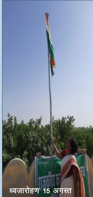
ध्वजारोहण 15 अगस्त