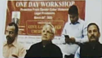
चूरु के विधि महाविद्यालय में मंगलवार को आयोजित कार्यशाला में मंचस्थ अतिथि।

सुरक्षित कैसे रहे। इस पर जवाब दिए जाने की जरूरत है। शर्मा ने कहा कि जो भी हम खेताल महिला का उपयोग करते हैं तो उसमें मिश्रितता का अभाव होता है। इसमें कड़ तात की जानकारीया नहीं जाती है लेकिन हम उस पर बिना फोक्स किए एक्सेस कर देते हैं। जिससे हमारी सारी सूचनाएं ऐसे लोगों के