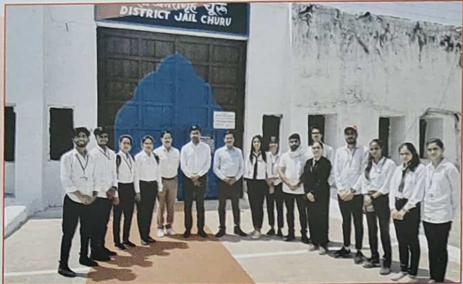
जेलों की स्थिति की जानकारी हेतु चूरु जिला कारागृह भ्रमण