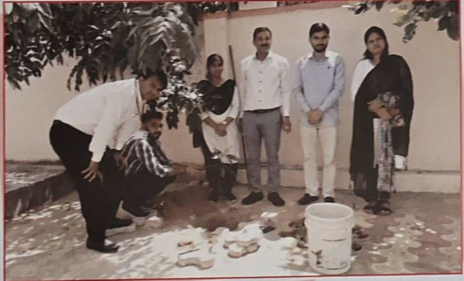
स्वच्छ पर्यावरण हेतु पौधारोपण कार्यक्रम