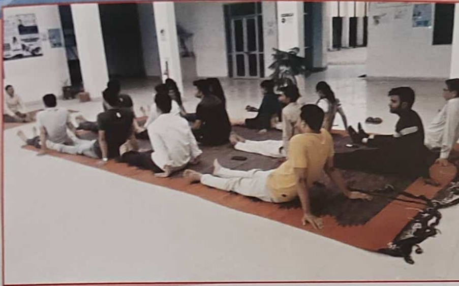
शरीर को निरोग रखने के लिए योगाभ्यास कार्यक्रम