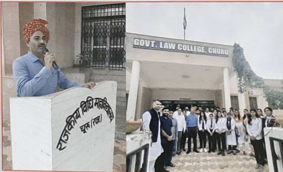
स्वतंत्रता दिवस समारोह