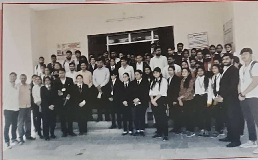
वैकल्पिक विवाद निस्तारण केन्द्र का भ्रमण