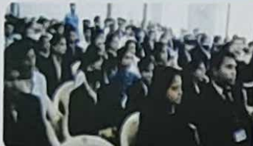
चूरु के विधि महाविद्यालय में मंगलवार को आयोजित कार्यशाला में मौजूद विद्यार्थी।