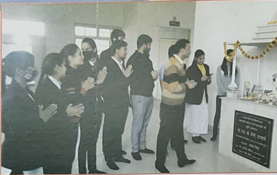
विवेक बुद्धि प्राप्त करने हेतु माँ सरस्वती वन्दन