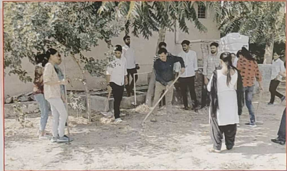
कॉलेज में सघन सफाई अभियान का शुभारम्भ करते प्राचार्य महोदय