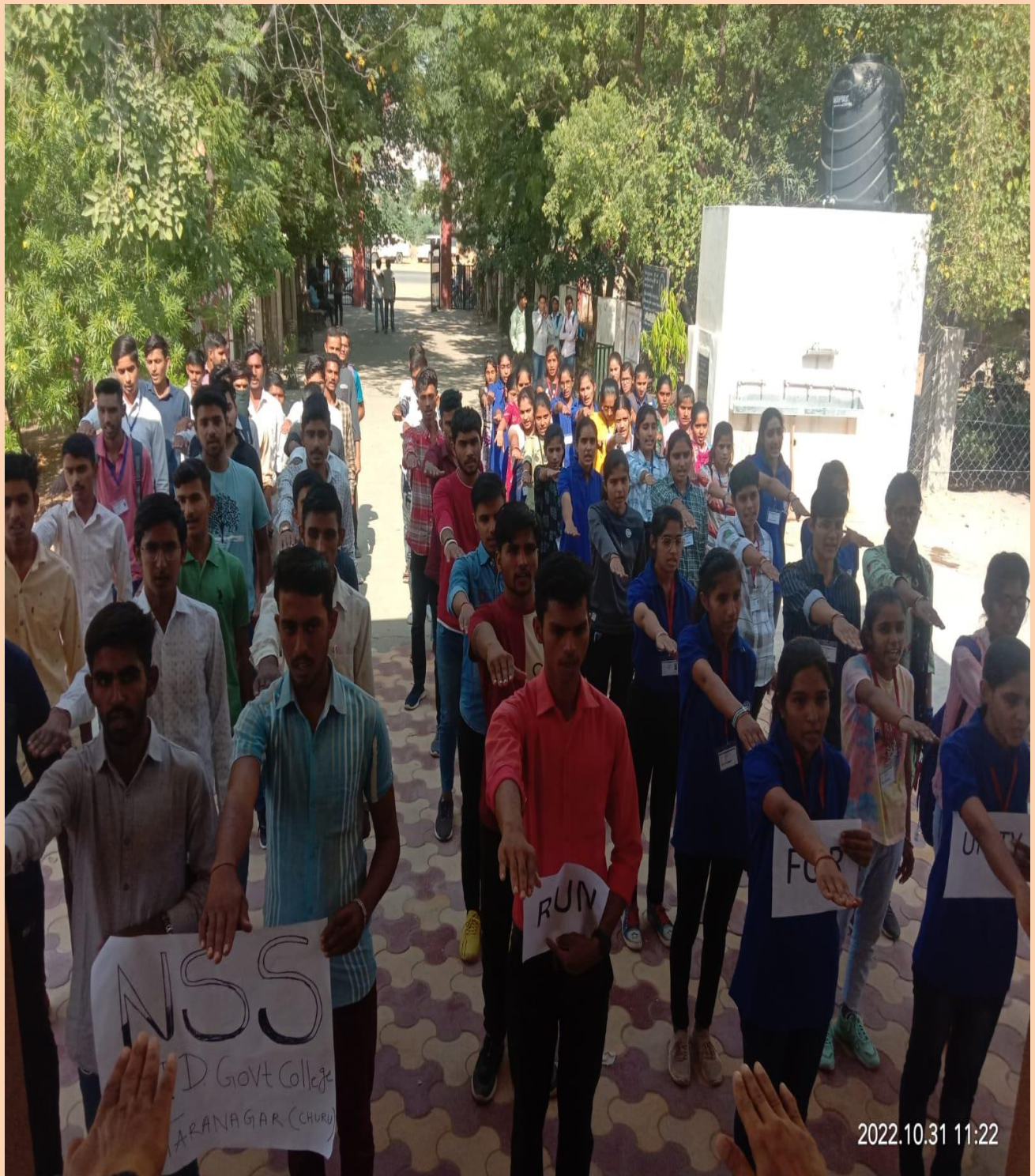
1- Volunteers, cadets and Staff Members Taking unity oath