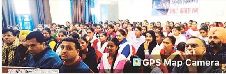
राजकीय महिला महाविद्यालय में प्रशिक्षण प्राप्त करते विद्यार्थी।