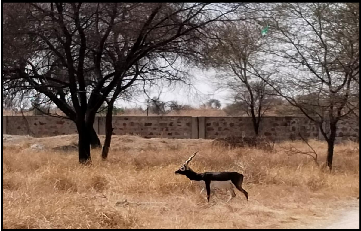
Antilope cervicapra (Black buck)

We got to encounter following animals inhabiting the sanctuary