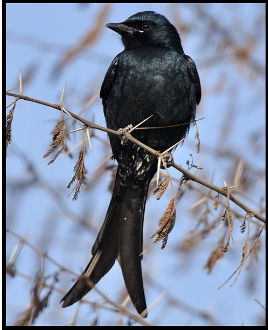
Dicrurus macrococercus (Black Drongo)