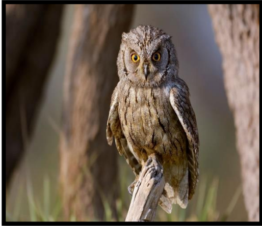
Indian scops owl