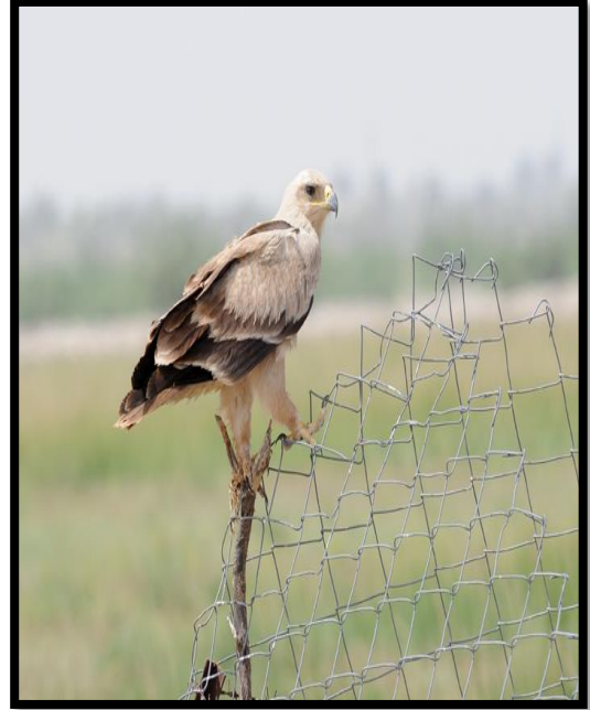
Aquila rapax (tawny eagle)