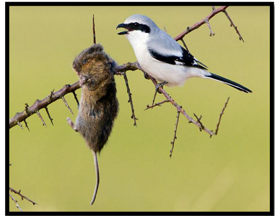
Great Gray Shrike