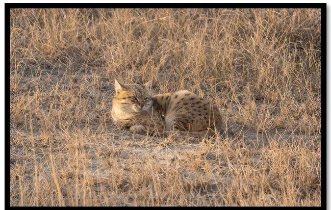
Felis silvestris (Desert cat)