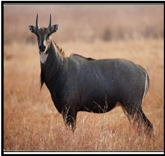
Boselaphus tragocamelus (nilgai)