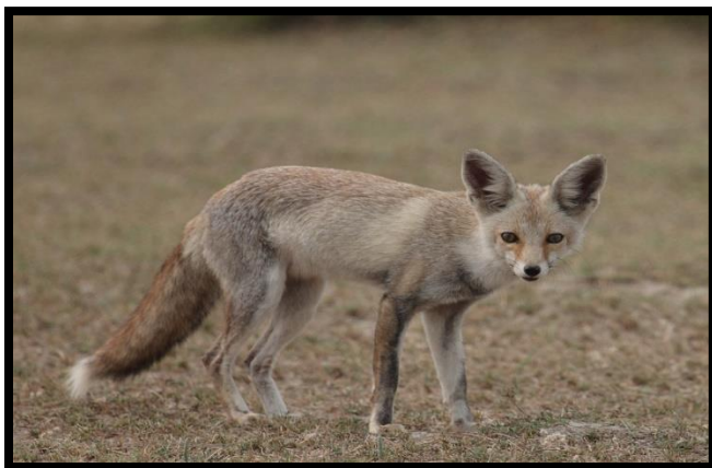
Noisy pilgrims (Desert fox)