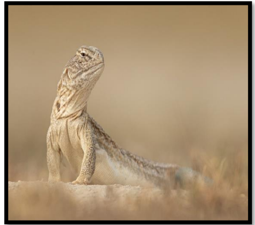
Spiny- tailed lizard