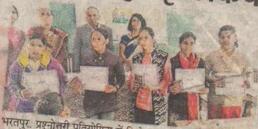
भरतपुर. प्रश्नोत्तरी प्रतियोगिता में विजेता छात्राएं।