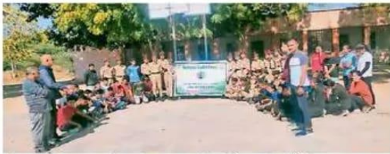
डीडवाना. आमजन को स्वच्छता का संदेश देते एनसीसी कैडेट्स।