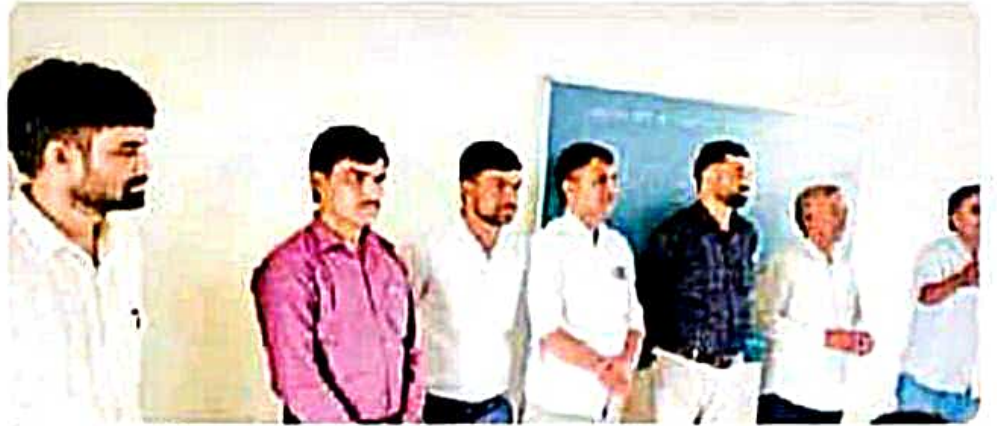
डेगाना. महाविद्यालय के विद्यार्थियों को नशा मुक्ति की शपथ दिलाते हुए।