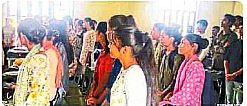
डेगाना. महाविद्यालय के विद्यार्थियों को नशा मुक्ति की शपथ लेते विद्यार्थी।

तहत, छात्रों ने अपने परिवार, मुक्त बनाने के लिए प्रतिबद्ध समुदाय, मित्रों और स्वयं को नशा रहने की प्रतिज्ञा की।