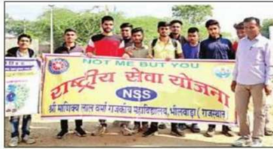
भीलवाड़ा में टेली निकाल मतदान का संदेश देते राशेयो सदस्य। -नवज्यात

कल्याण भास्कर का नवज्यात समापन | युवाओं का उत्साह और उत्साह