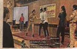
छात्राओं को शिविर में आत्मरक्षा तकनीक का प्रशिक्षण