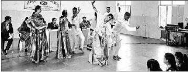
भीलवाड़ा के एमएलवी कॉलेज में आयोजित शिविर में सांस्कृतिक कार्यक्रमों की प्रस्तुतियां देते हुए।