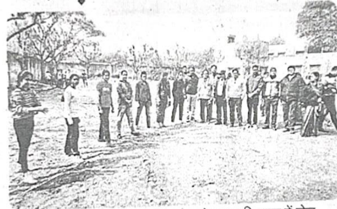
किशनगढ़. आर.के. पाटनी राजकीय स्नातकोत्तर महाविद्यालय में खेल सप्ताह के तहत दौड़ने के लिए तैयार छात्राएं एवं मौजूद प्रबंधन के सदस्य।