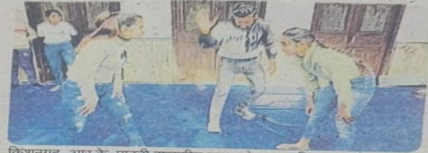
किशनगढ़, आर.के. पाटनी राजकीय स्नातकोत्तर महाविद्यालय परिसर में कुश्ती प्रतियोगिता में दांव पेच आजमाती छात्राएं।

मदनगंज-किशनगढ़ @ पत्रिका. राजकीय कन्या महाविद्यालय में खेल सप्ताह के अंतर्गत मंगलवार को प्रश्नोत्तरी प्रतियोगिता, शतरंज, भाला फेंक, गोला फेंक, तश्तरी फेंक एवं कुश्ती प्रतियोगिताएं हुईं।