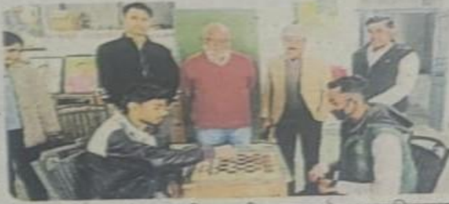
किशनगढ़, आर.के. पाटनी राजकीय स्नातकोत्तर महाविद्यालय में शतरंज खेलते खिलाड़ी एवं मौजूद प्रबंधन के सदस्य।