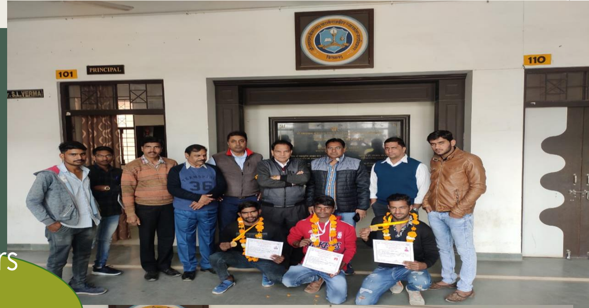
Winners of wrestling Team