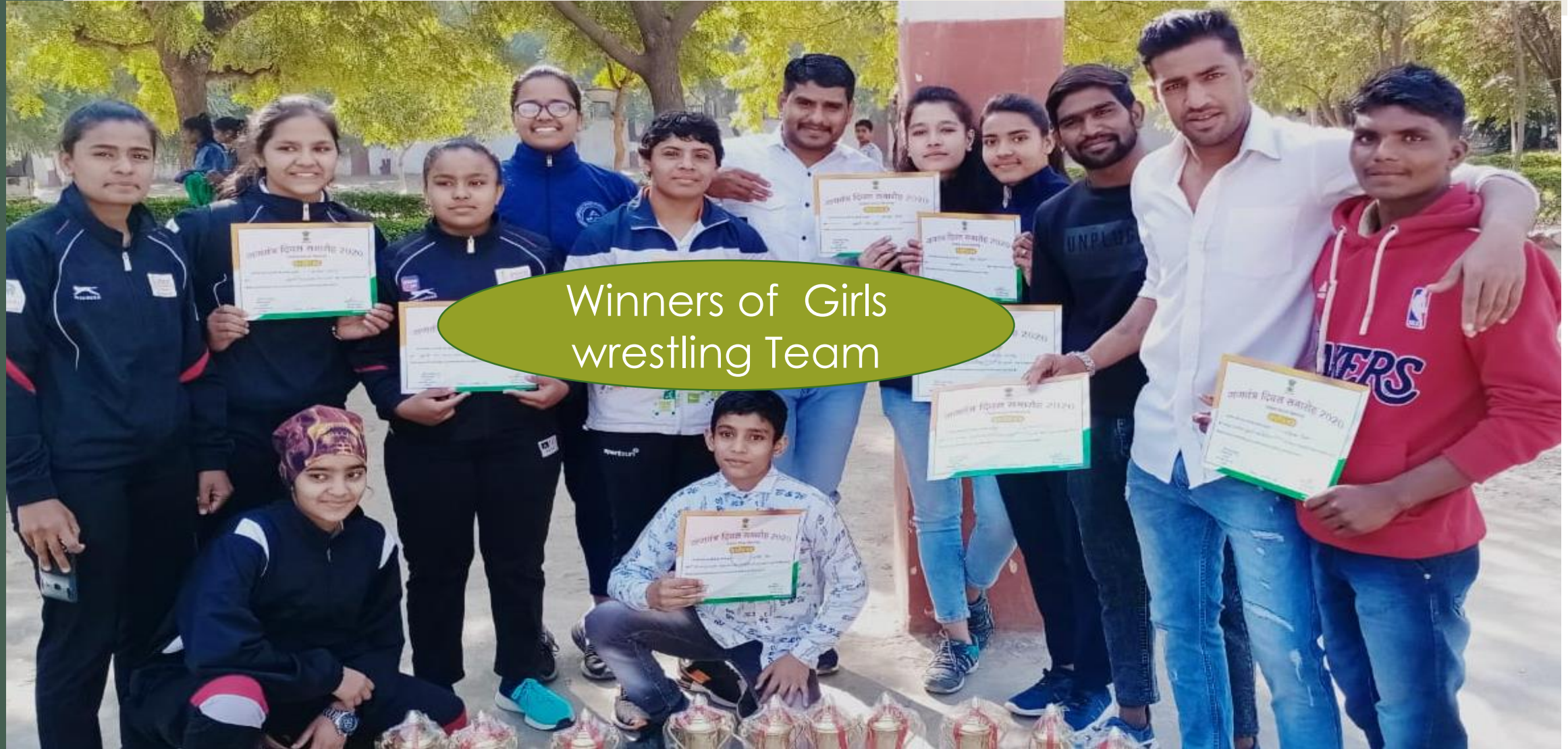
Winners of Girls wrestling Team