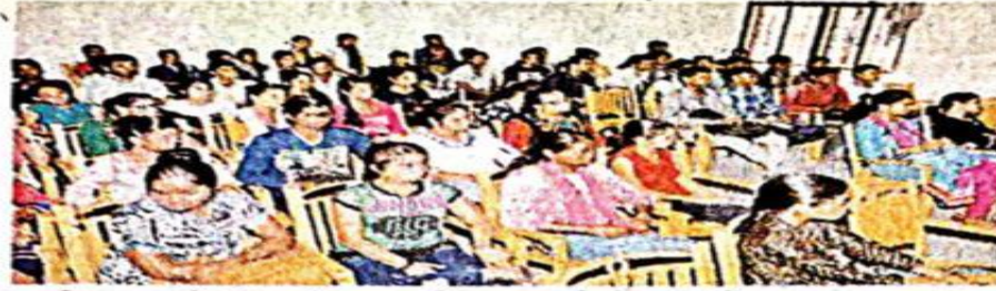
महाविद्यालय में जीएसटी पर आयोजित कार्यशाला में मौजूद छात्र-छात्राएँ।