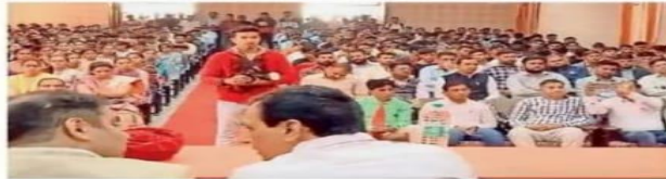
नागौर, मिर्धा कॉलेज में रोजगार मेले को लेकर उद्घाटन कार्यक्रम में मौजूद अतिथि व युवा।