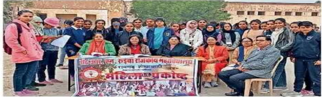
रामगढ़ शेखावाटी फोटो। खेल सप्ताह के उद्घाटन में मौजूद अतिथि व विद्यार्थी।