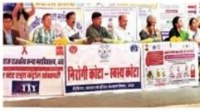
जागृती देगी बजाज कन्या महाविद्यालय में आयोजित जागरूकता कार्यक्रम को संबोधित करते हुए सीएमएचओ व अन्य।