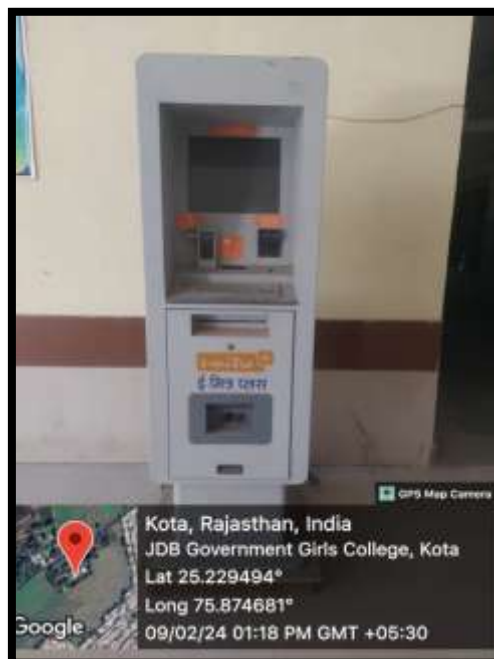
E-Mitra Plus Kiosk