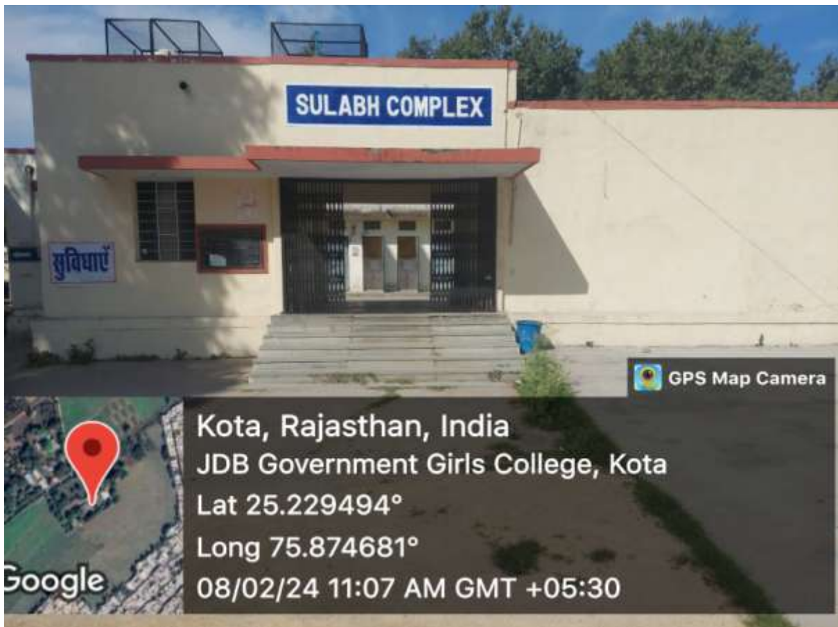
Sulabh Complex in Campus