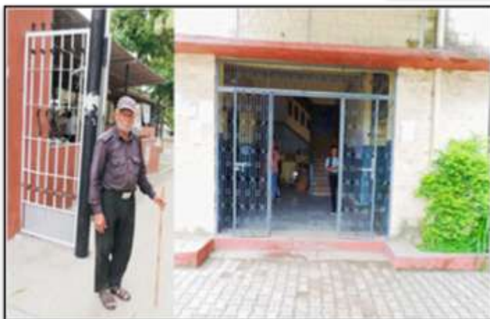
Channel Gates & Security Guards