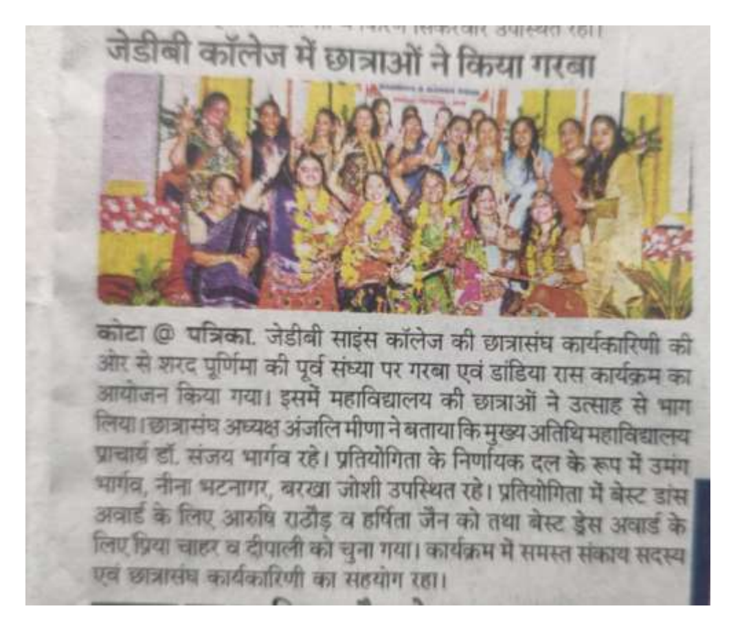
Garba celebration in college