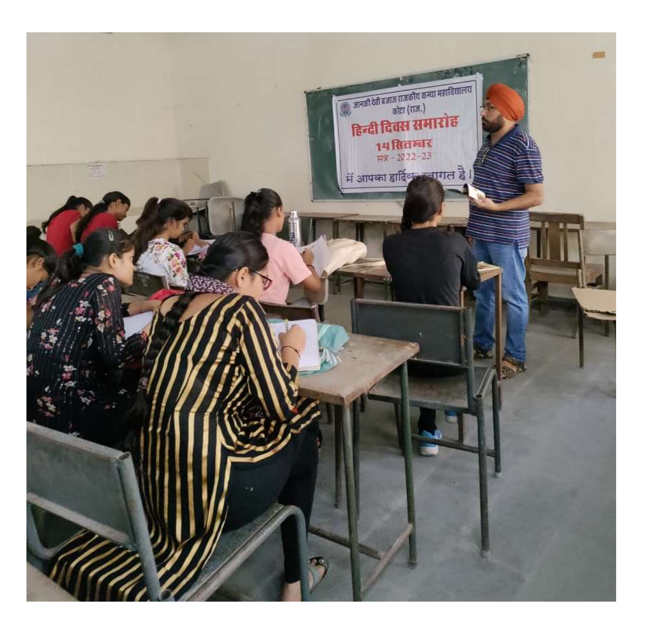
Hindi Divas Celebration