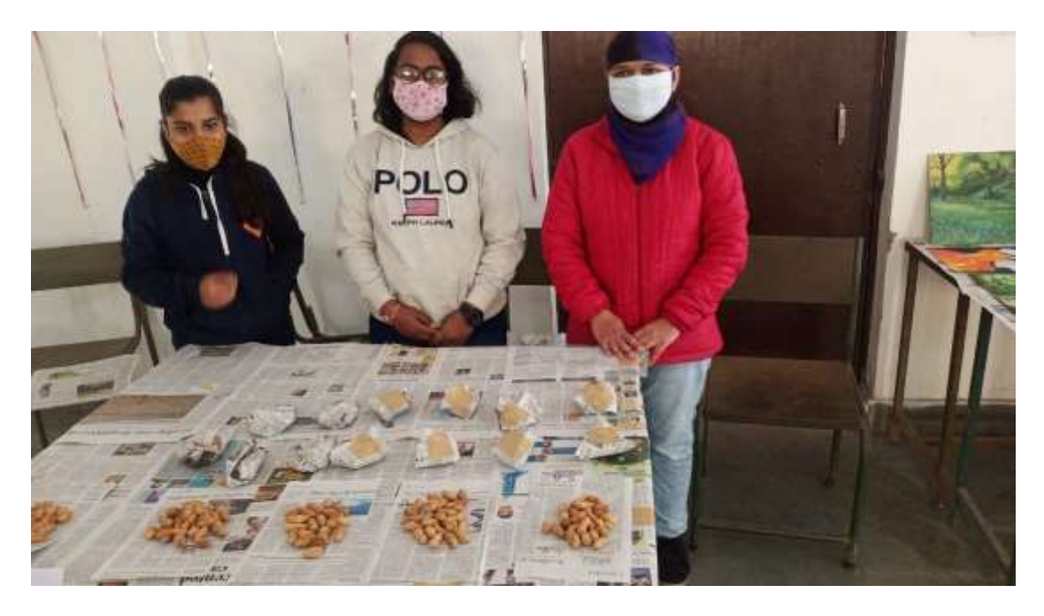
Celebration of Makar Sankranti