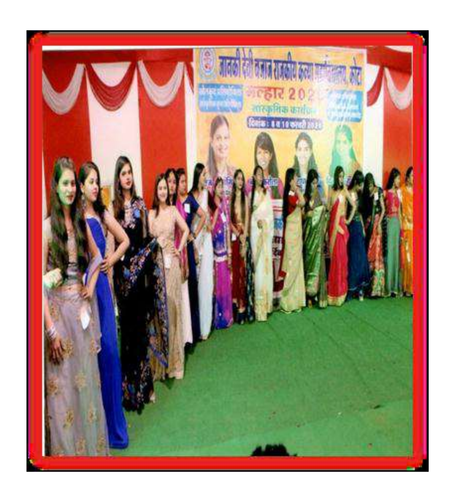
Regional Dress Competition