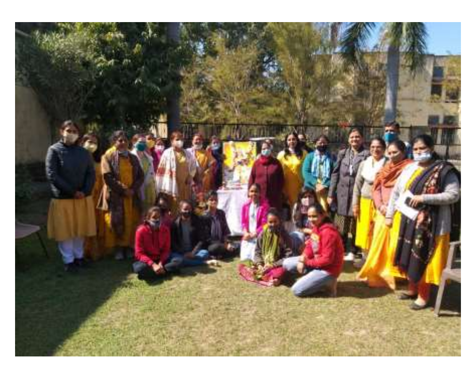
Celebration of Basant Panchami