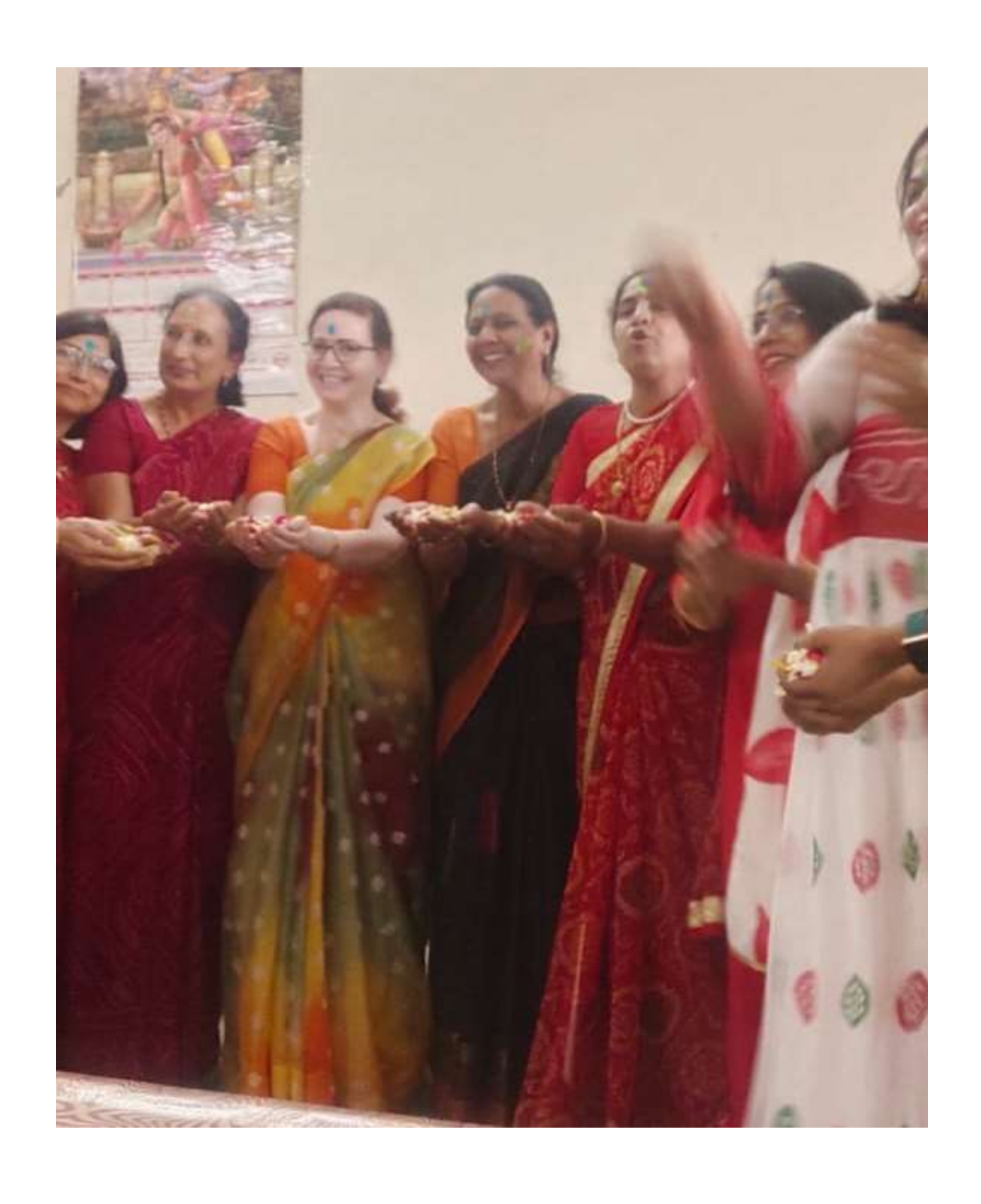
Celebration of Holi