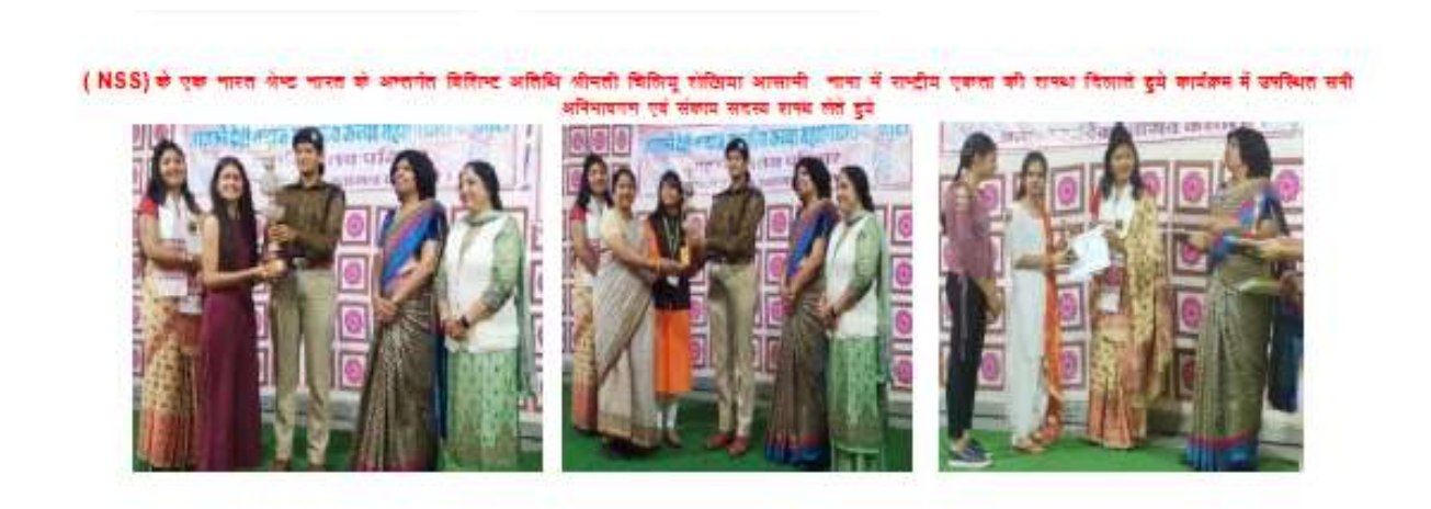
The knowledge of culture, language and practices of Rajasthan and Assam were shared