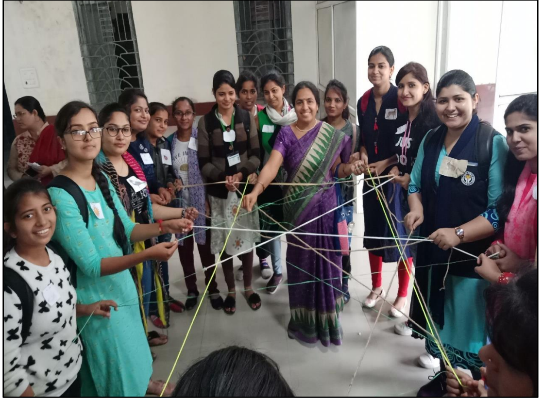
"Web of Life Game" activity organized on 30/11/2019