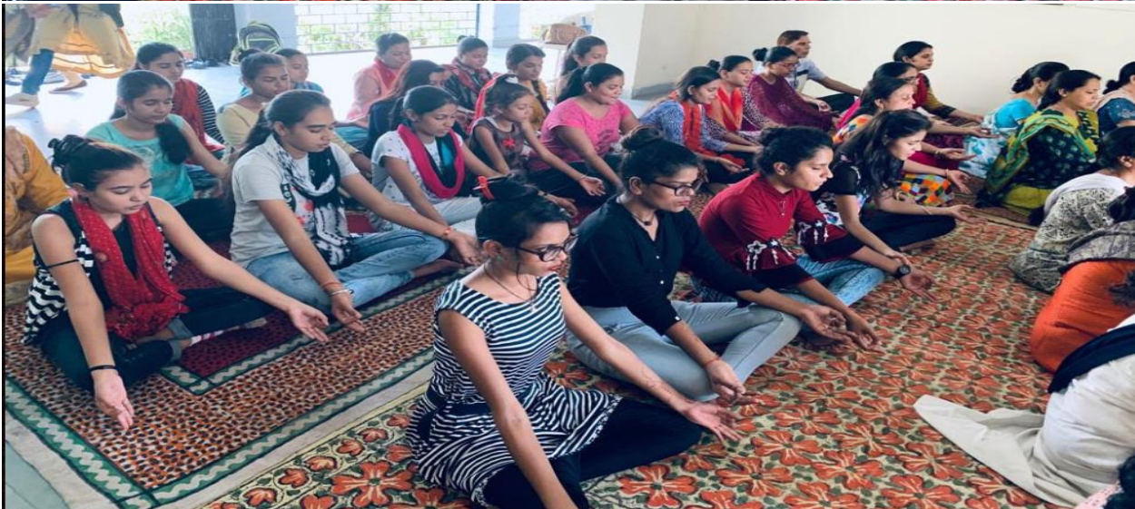
INTERNATIONAL YOGA DAY CELEBRATION ON 21.06.2019