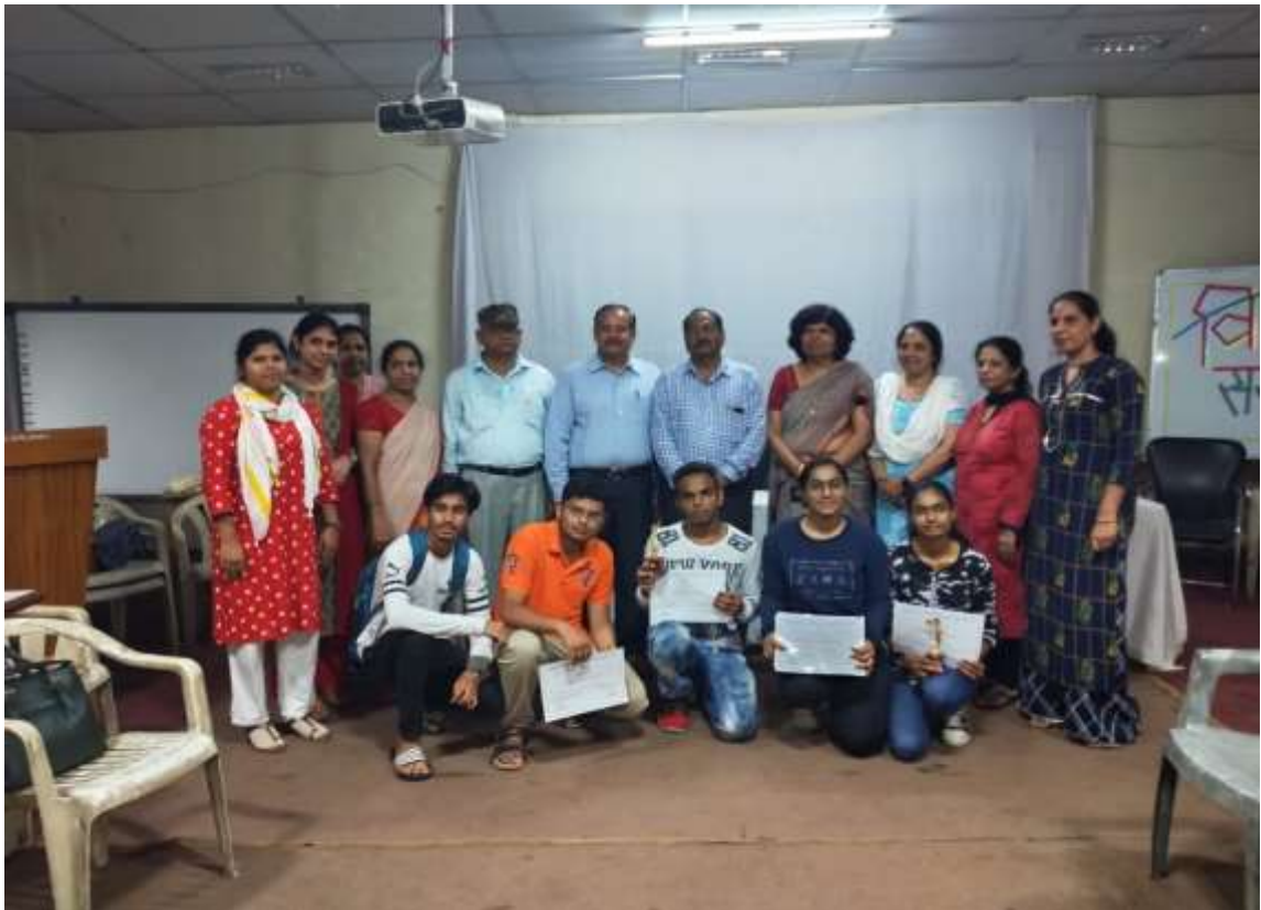
प्राचार्य, खेल समिति एवं प्रतिभागी