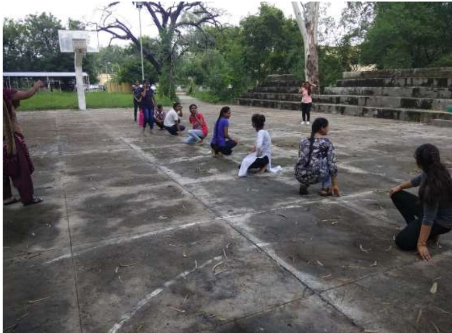
खो खो प्रतियोगिता