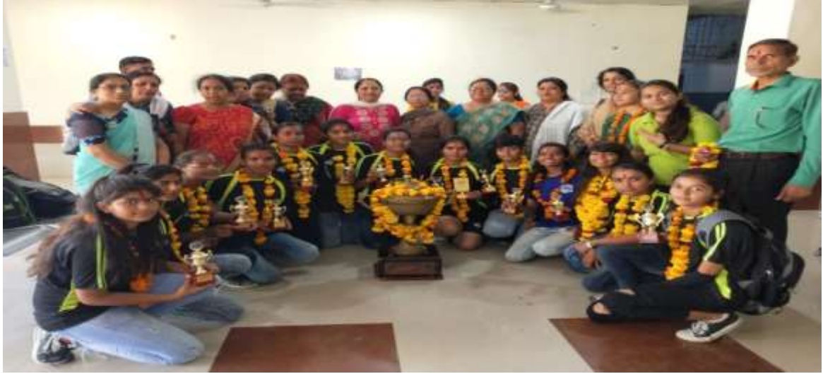
अन्तरमहाविद्यालय बास्केटबॉल प्रतियोगिता में चलवैजंती ट्रॉफी के साथ महाविद्यालय की विजेता छात्राएं