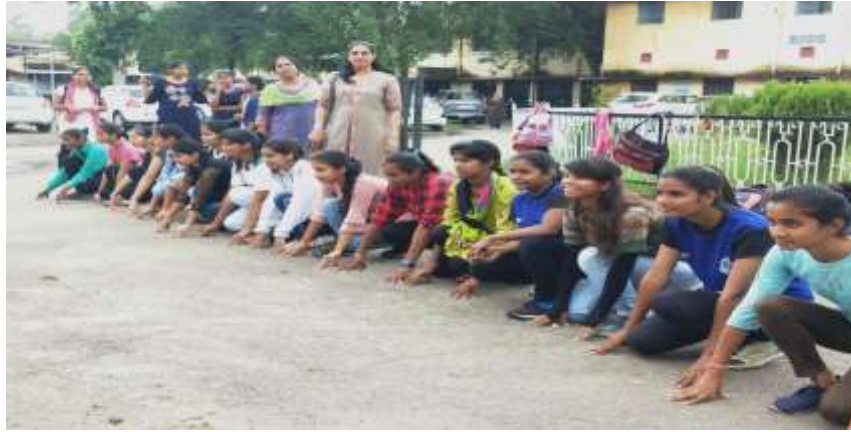
100 मीटर दौड़

जानकी देवी बजाज राजकीय कन्या महाविद्यालय, कोटा में दिनांक 14-08-2019 से 29-08-2019 तक अर्जुन दृष्टि, क्रीडा खेल कूद कार्यक्रम के अंतर्गत अन्तर हाउस प्रतियोगिताओं में चयनित खेल जैसे : कबड्डी, बास्केट बॉल, एथलेटिक्स, बैडमिंटन, शतरंज, खो खो, राष्ट्रीय खेल दिवस का आयोजन किया गया। जानकी देवी बजाज राजकीय कन्या महाविद्यालय, कोटा में दिनांक 29-08-2019 को राष्ट्रीय खेल दिवस के रूप में मनाया गया