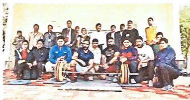
कालाडेरा: महाविद्यालय में वेटलिफ्टिंग प्रतियोगिता में प्रदर्शन करते विजेता।