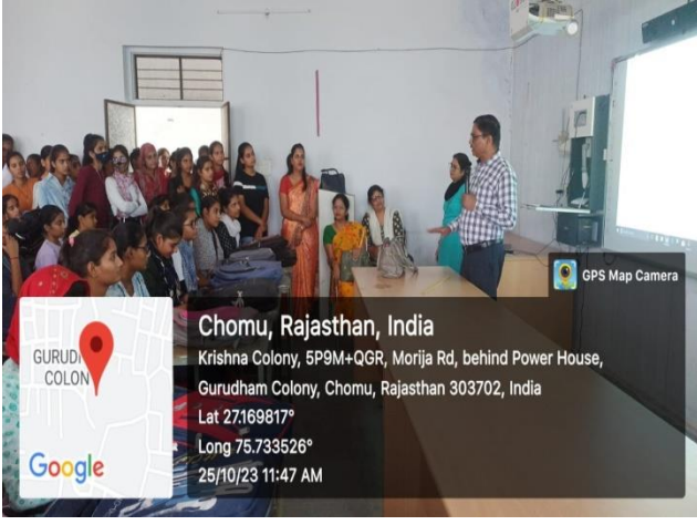
NEP Orientation में प्राचार्य द्वारा संबोधन