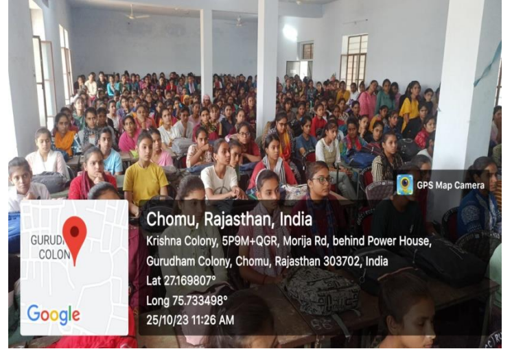
NEP Orientation में उपस्थित छात्राएँ