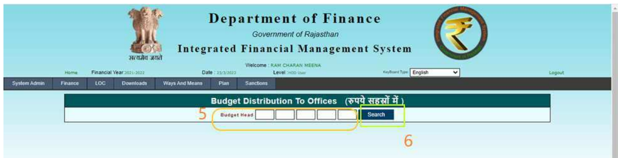
Fig – 2