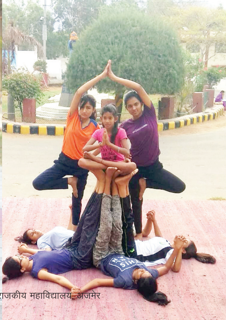
सम्राट पृथ्वीराज चौहान राजकीय महाविद्यालय, अजमेर