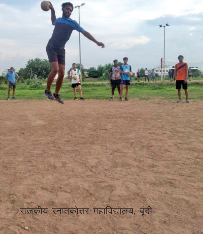
राजकीय स्नातकोत्तर महाविद्यालय, बूंदी