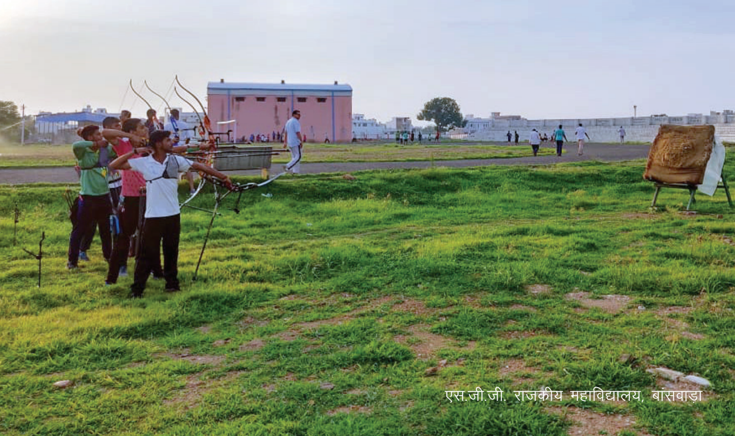
एस.जी.जी. राजकीय महाविद्यालय, बांसवाड़ा